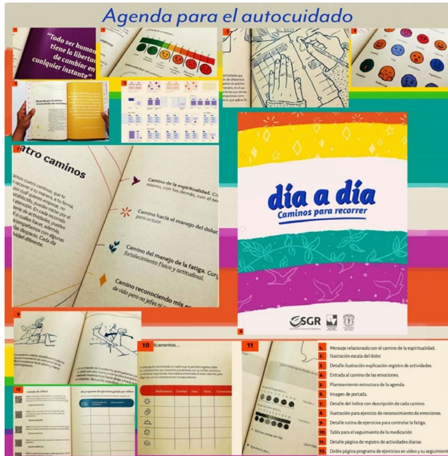
Figura 1. Registro fotográfico de algunos apartados del material didáctico