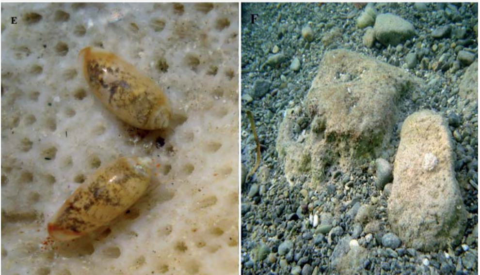
Lámina 1.- Volvarina baconi , especie nueva: A-B. Holotipo; C-D. Aspecto de los ejemplares vivos; E. Animales vivos observados in situ , debajo de una piedra coralina; F. Ambiente donde fueron colectados.