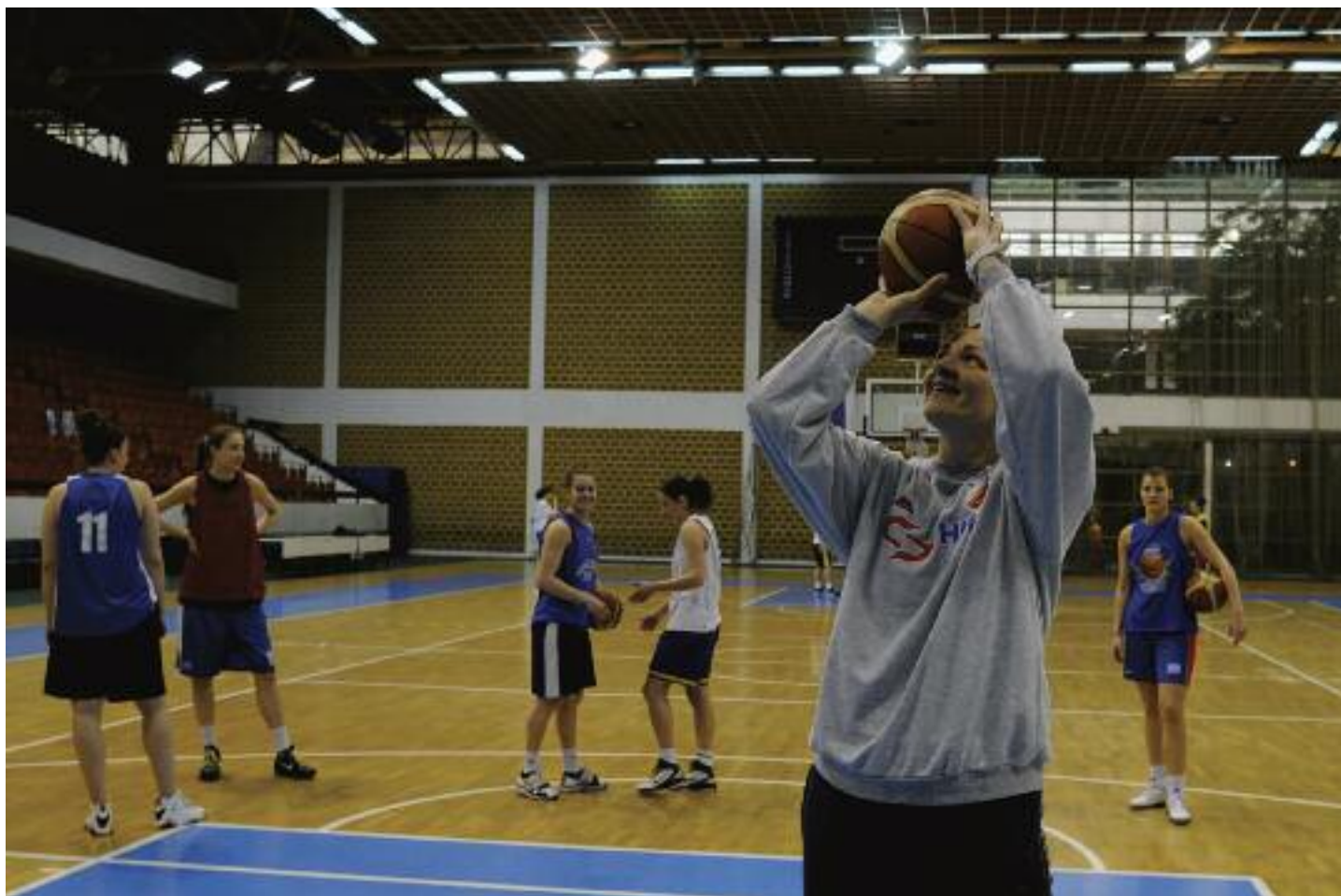
Novi Sad, 15. april 2011.