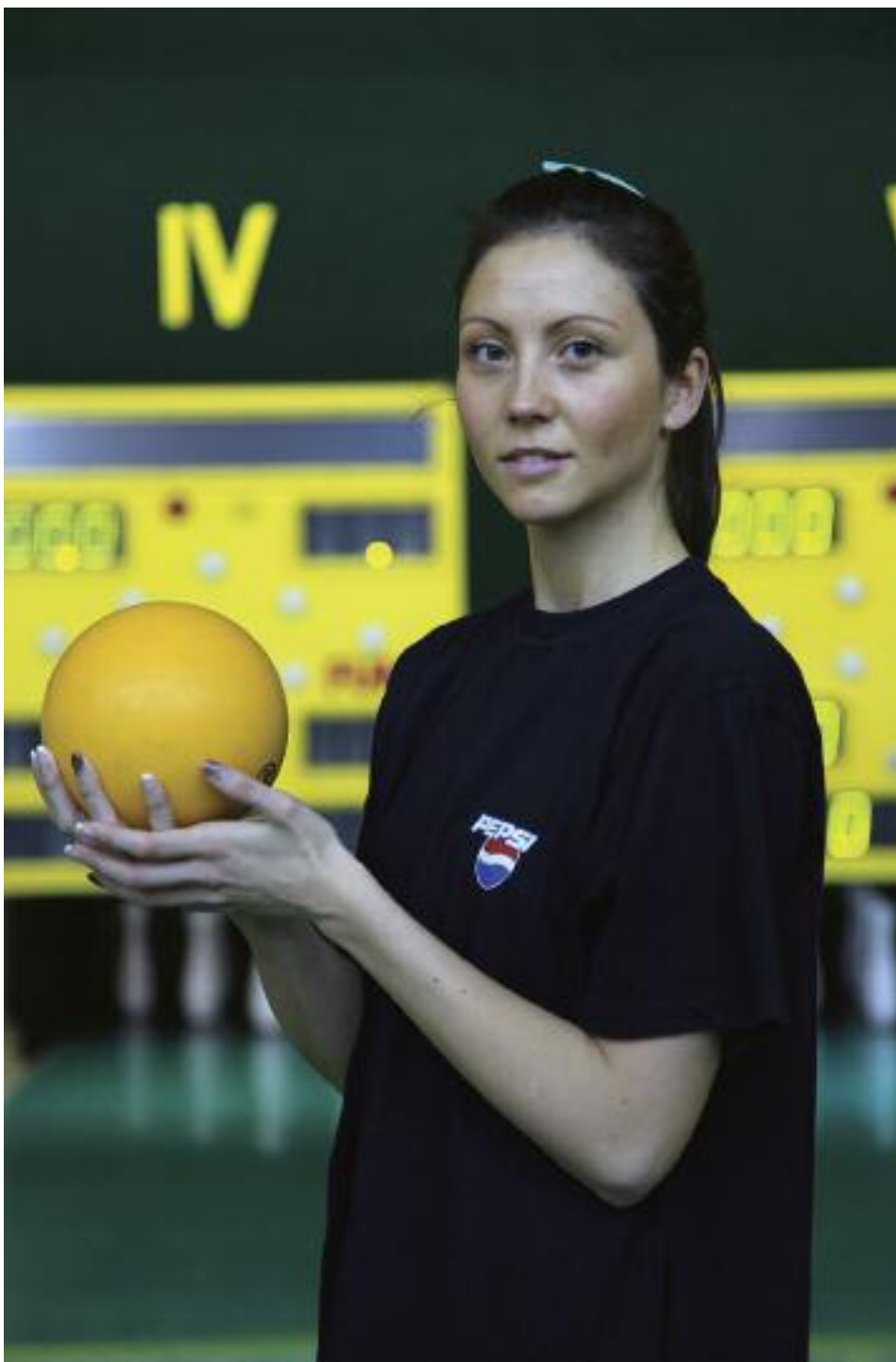
Novi Sad, 23. mart 2011.