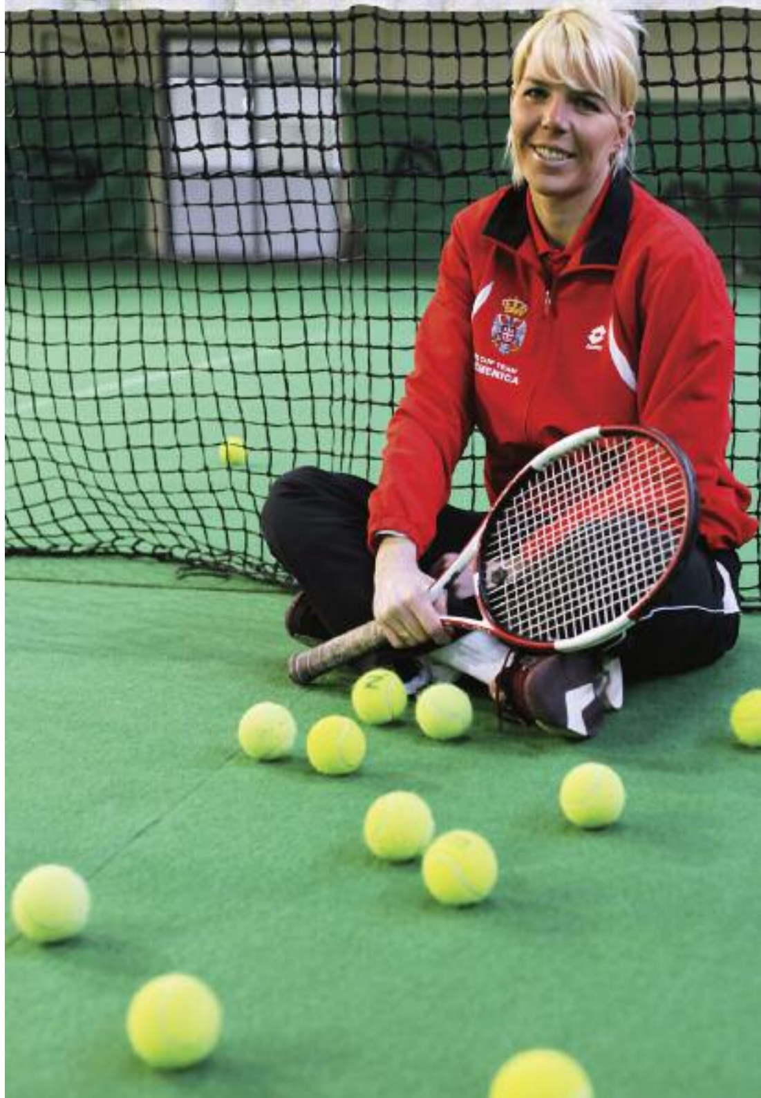
Položaj žena u sportu u Vojvodini

Novi Sad, 19. mart 2011.