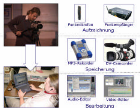
Abbildung 2: IKT-Nutzung zur Produktion

Nach der Veranstaltung werden die Vorlesungsmitschnitte mit Audio- oder Videoeditoren bearbeitet. Die editierten Aufnahmen werden in ein Streaming-Format