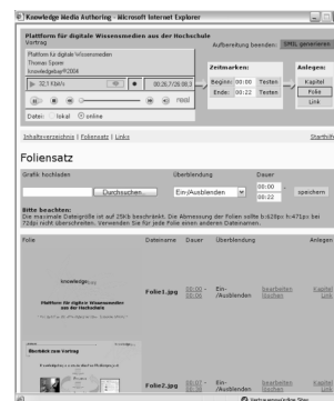
Abbildung 4: Aufbereitung im Autoren-Tool

Die durchschnittliche Produktionszeit für Beiträge in der hier dargestellten aufbereiteten Form entspricht der Summe aus Aufzeichnungszeit (Echtzeit), tontechnischer Überarbeitungszeit (1/4 der Echtzeit) und Aufbereitungszeit (je nach Art und Umfang doppelte bis vierfache Echtzeit) 2 . Mit der zunehmenden Verbreitung automatischer