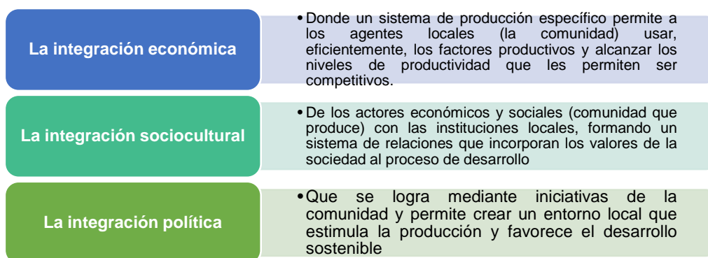
Figura 3. Integración de factores