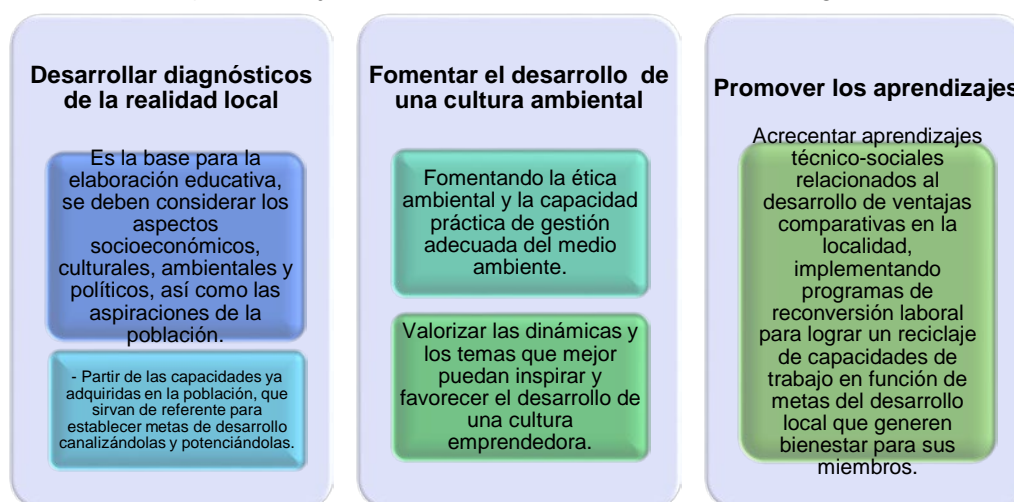
Figura 1. Objetivos fundamentales del Desarrollo Endógeno

Sustentado en Vázquez (2007)