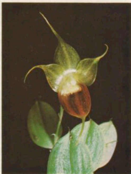
Brachionidium kuhniarum , Dressler sp. nov.

Epífita, rastrera o colgante; rizoma delgado, 6-8 mm entre ramas, cubierto por vainas tubulares, acuminados, blancuzcos; tallos 3-4 mm de largo, cubiertos por brácteas tubulares acuminados; hojas solitarias, pecíolo 1.5-2 mm de largo, lámina anchamente elíptica u ovado-elíptica, con 7 nervaduras cuando seca, 7-12 mm de largo, 7-8.5 mm de ancho, tridentada, el diente intermedio mucho más largo que los laterales; inflorescencia de una flor, 7-16 mm de largo, con 1 o 2 brácteas tubulares, acuminadas, 3-4 mm de largo; bráctea floral anchamente infundibuliforme, acuminada, aprox. 2 mm de largo, con una seta 1.5 mm de largo; flores no resupinadas; ovario con pedicelo aprox. 2 mm de largo; sépalo dorsal elíptico-ovado, lámina 6 mm de largo, 4 mm de ancho, trinervada, cola 5.5 mm largo; lámina del sinsépalo cóncava, orbicular-ovada, 7 mm de largo, 8 mm de ancho, la cola 5 mm de largo, los ápices libres de aprox. 1.5 mm; pétalos oblicuamente ovados, las láminas 5.5 mm de largo, 3 mm de ancho, la cola aprox. 3.5 mm de largo; labelo anchamente obovado, truncado, 2 mm de largo, 3 mm de ancho, abruptamente recurvado, con un callo cóncavo y subdeltoide en la base, apiculado; columna 1.5 mm de largo y ancho; estigma bilobado, cada lóbulo con un diente prominente abajo; polinios: 2 en forma de "U", 1 mm de largo (4 polinios claviformes unidos en pares por los ápices), 2 claviformes más cortos, y 2 rudimentarios.