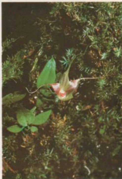
Brachionidium folsomii , Dressler sp. nov.

presión central aprox. 0.8 mm de ancho que incluye un callo oblongo; columna aprox. 1.2 mm de largo, 1.8 mm de ancho; estigma bilobado, cada lóbulo con un diente pequeño abajo; polinios 6, largamente claviformes, con un viscidio pequeño.