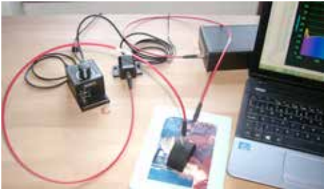
La conservation préventive devient parfois prédictive. Les travaux initiés au Getty Conservation Institute ont conduit à la réalisation du Microfade Tester portable, appareil de micro test in situ de sensibilité à la lumière. Cet instrument permet de mesurer, en quelques minutes, le changement de couleur

Ainsi, la conservation préventive des collections prend une place toujours plus grande dans l'activité des conservateurs-restaurateurs. Le travail du restaurateur