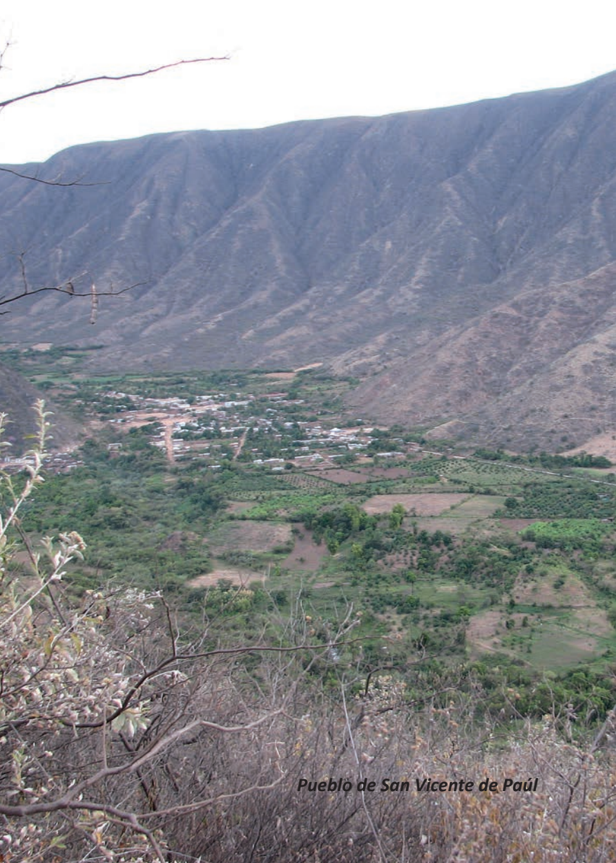
Pueblò de San Vicente de Paúl