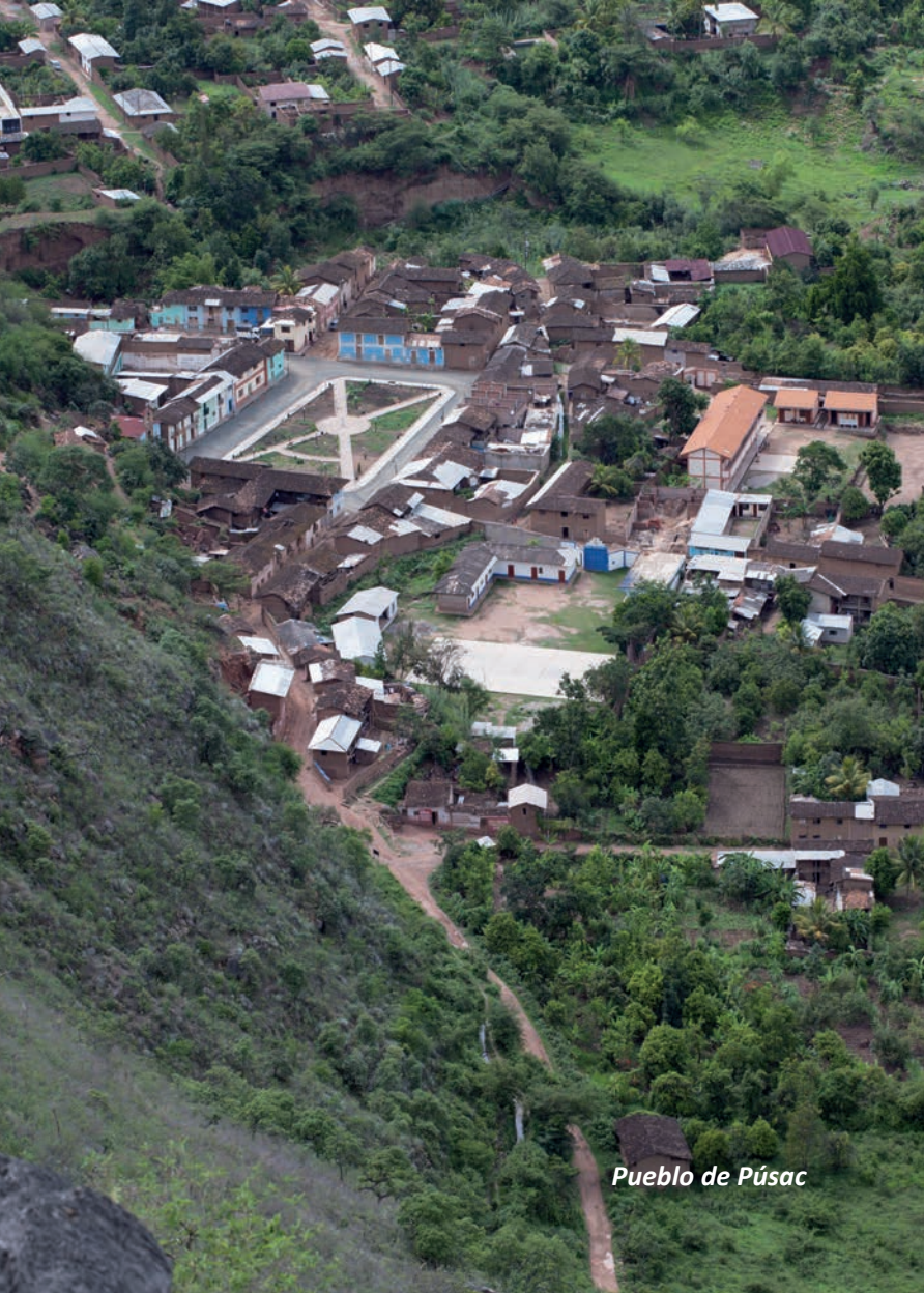
Pueblo de Púsac