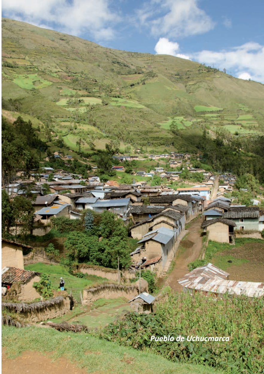
Pueblo de Uchucmarca