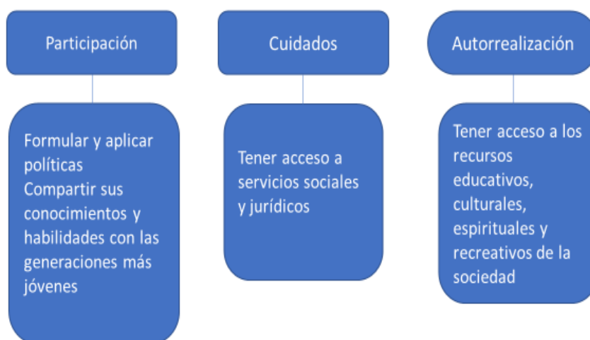
Fig. 1. Aspectos relacionados con la información.

b. Principios de las Naciones Unidas en favor de las Personas de Edad (1991). Considera cinco aspectos: independencia, participación, cuidados, autorrealización y dignidad, se destacan los siguientes (ver Fig. 1).