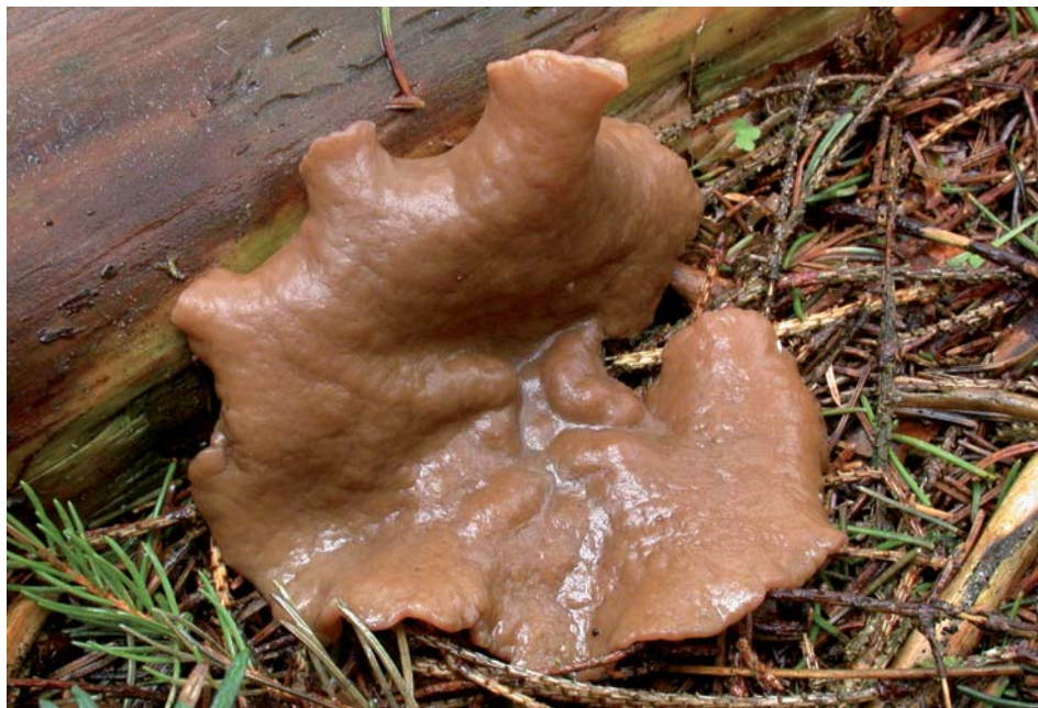
Gyromitra perlata 23-IX-2006, Belcaire (Aude, France).