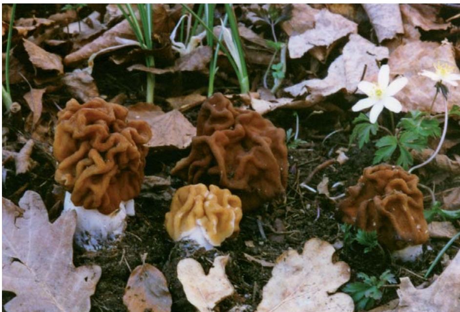
Gyromitra ticiniana 14-III-2001, Novaggio, Valèra (Ticino, Suisse).