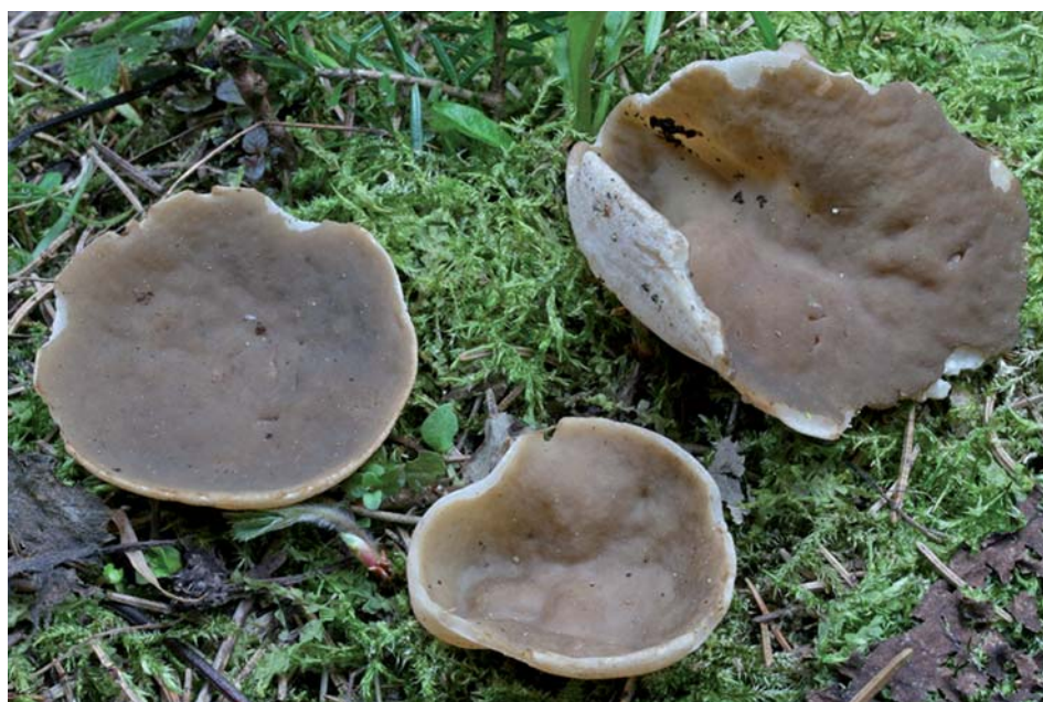
Gyromitra geogenia 25-IV-2009, Méaudre (Isère, France).