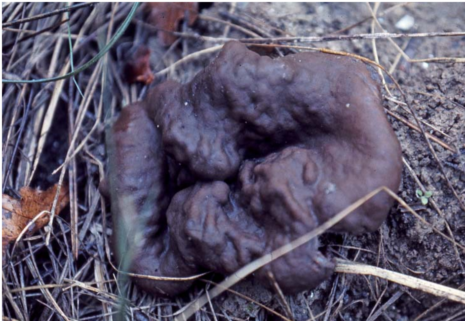
Gyromitra megalospora ??-??-1975, Maillane (Bouches-du-Rhône, France).