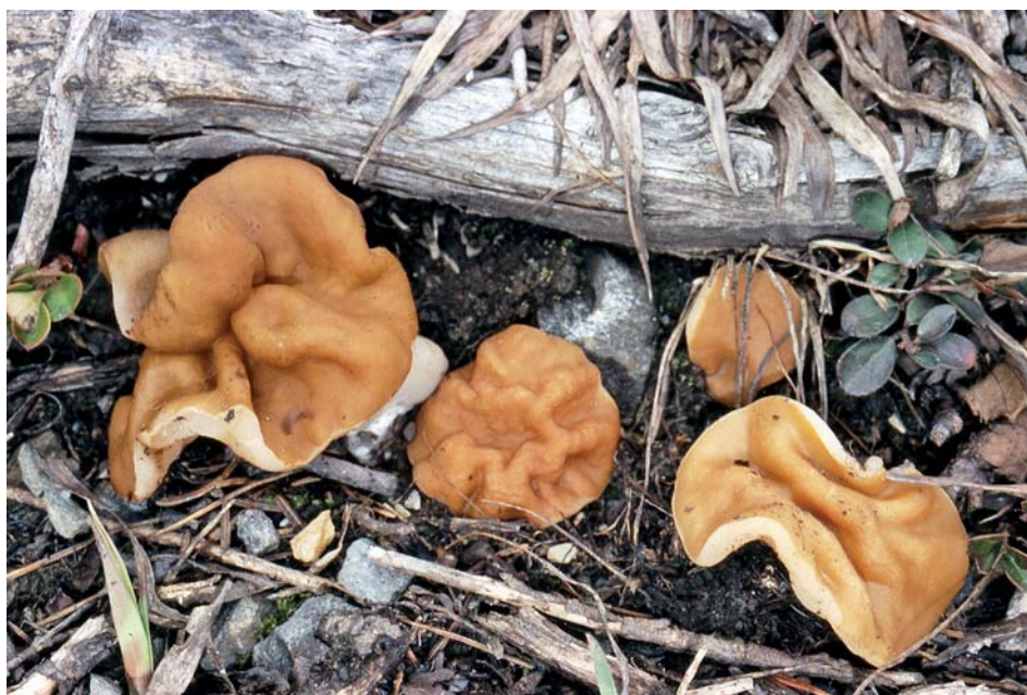
Gyromitra accumbens 8-V-2005, La Rosière (Savoie, France). Jeunes spécimens.