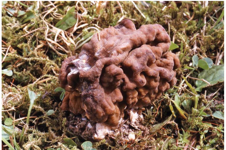
Gyromitra gigas 10-V-2003, Méribel (Savoie, France).