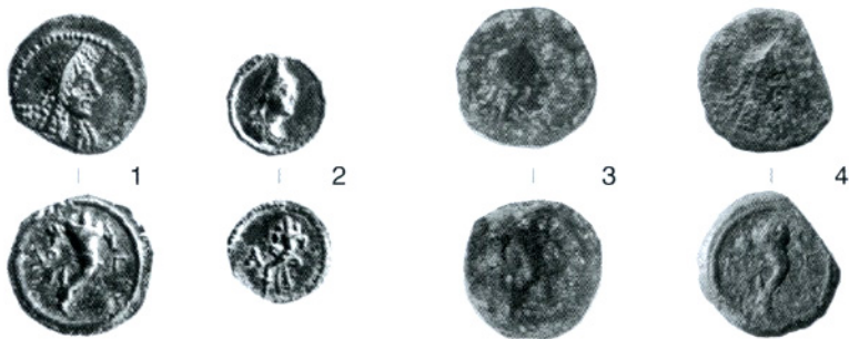
Fig. 1 : Monnaies des Longostalètes à la corne d'abondance : 1 et 2, British Museum (Depeyrot 2002, types 154 et 155) ; 3, Clermont-l'Hérault, Peyre-Plantade (ML-031) ; 4, Montredon-des-Corbières.

• Dep. 155 ; 2,5 g A/Buste diadémé de femme, à droite R/A, corne d'abondance (fig. 1, n° 2).