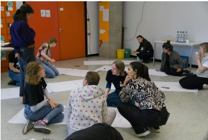
Abb. 2: Workshop-Arbeit in Kleingruppen

Der Workshop „Grenzen der Gewalt: Verschwommene Ränder“ brachte auch neue Erkenntnisse für diejenigen, die mit dem Thema der Feministischen Geographie bereits vertraut waren. Persönliche Erlebnisse fanden hier genauso Platz wie abstrakte und theoretische Konzepte von Gewalt als Konstrukt. Auch der Raumbezug wurde auf mehreren Ebenen hergestellt. Hier ließ sich auch die Verknüpfung verschiedener Sessions besonders gut erkennen: Die Eindrücke, die die Teilnehmenden während der Filmvorführung gewonnen hatten, konnten als Beispiele verschiedener Formen von Gewalt genutzt und eingeordnet werden.