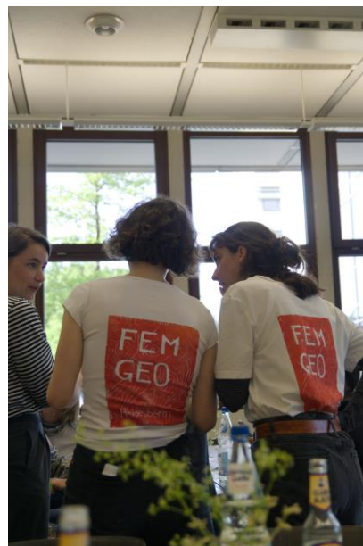
Abb.1: Das Orgateam des AK FemGeo Heidelberg

Unter dem Motto „Endlich – vom Anfangen und Aufhören“ fanden drei Tage lang Workshops, kreative Sessions und Vernetzungsangebote statt. Das Vernetzungstreffen, das in den Räumlichkeiten unseres Instituts, der Universität und des Kunstvereins Heidelberg stattfand, stieß insgesamt auf viel Anklang in- und außerhalb Heidelbergs. Wichtig war uns insbesondere der offene Zugang und die Möglichkeit nicht-deutschsprachiger Teilnahme. Die zweisprachige Moderation und zahlreiche Workshops in englischer Sprache bereicherten unsere gesamte Veranstaltung und wurden im Nachhinein auch von den Teilnehmenden positiv bewertet.