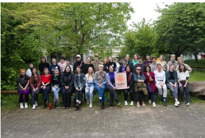
Abb. 4: Gruppenfoto des Vernetzungstreffens

Nach einem Abschied auf der Neckarwiese endete unser Vernetzungstreffen mit zahlreichen Impulsen für unsere Teilnehmenden ebenso wie für uns als Organisator:innen. Sowohl unser internes Feedback als auch die Rückmeldungen der Teilnehmenden zeigten die Bilanz eines erfolgreichen Wochenendes. Die Reichweite des Vernetzungstreffens erstreckte sich über weite Teile Deutschlands. Aus Leipzig, Berlin, Lüneburg, aber auch aus Wien und Innsbruck reisten Teilnehmende an, die mithilfe unserer Bettenbörse Schlafplätze für das Wochenende finden konnten. Insgesamt war das Fazit der Einbindung Feministischer und Kritischer Geographien an deutschen Universitäten ernüchternd, aber viele konnten einen Motivationsschub zu weiterem Engagement und viele Anregungen zum Weiterdenken mitnehmen. Großer Dank für dieses Vernetzungstreffen gebührt dabei neben unseren Referent:innen auch unseren Sponsoren und Unterstützer:innen, zu denen der AK Feministische Geographien, die Rosa-Luxemburg-Stiftung, der Stadtjugendring Heidelberg und die Universität Heidelberg gehören. Auch dem Geographischen Institut danken wir für die Unterstützung und die Räumlichkeiten, in denen wir das Wochenende ausrichten konnten.