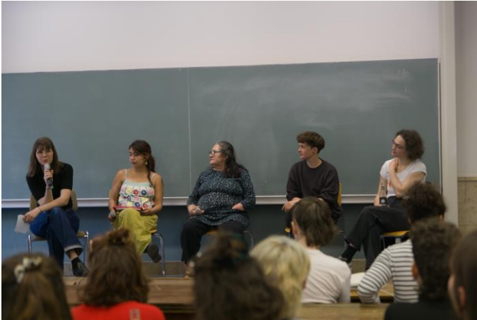
Abb.3: Podiumsdiskussion in der Neuen Universität

Nach einem Abschied auf der Neckarwiese endete unser Vernetzungstreffen mit zahlreichen Impulsen für unsere Teilnehmenden ebenso wie für uns als Organisator:innen. Sowohl unser internes Feedback als auch die Rückmeldungen der Teilnehmenden zeigten die Bilanz eines erfolgreichen Wochenendes. Die Reichweite des Vernetzungstreffens erstreckte sich über weite Teile Deutschlands. Aus Leipzig, Berlin, Lüneburg, aber auch aus Wien und Innsbruck reisten Teilnehmende an, die mithilfe unserer Bettenbörse Schlafplätze für das Wochenende finden konnten. Insgesamt war das Fazit der Einbindung Feministischer und Kritischer Geographien an deutschen Universitäten ernüchternd, aber viele konnten einen Motivationsschub zu weiterem Engagement und viele Anregungen zum Weiterdenken mitnehmen. Großer Dank für dieses Vernetzungstreffen gebührt dabei neben unseren Referent:innen auch unseren Sponsoren und Unterstützer:innen, zu denen der AK Feministische Geographien, die Rosa-Luxemburg-Stiftung, der Stadtjugendring Heidelberg und die Universität Heidelberg gehören. Auch dem Geographischen Institut danken wir für die Unterstützung und die Räumlichkeiten, in denen wir das Wochenende ausrichten konnten.