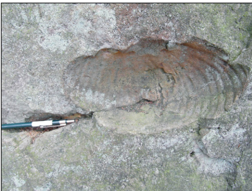
Abb. 2: Abdruck von Prodichotomites sp. im Steinbruch an der Waldkapelle.

Wahrscheinlich handelt es sich um einen Steinbruch, der von den umliegenden Bauernhöfen privat zur Gewinnung von Bruchsteinen betrieben wurde. Selten sind Relikte dreieckiger Bohrlöcher mit einem Durchmesser von ca. 5 cm erhalten. In der Hauptwand findet sich der Abdruck eines großen Ammo-