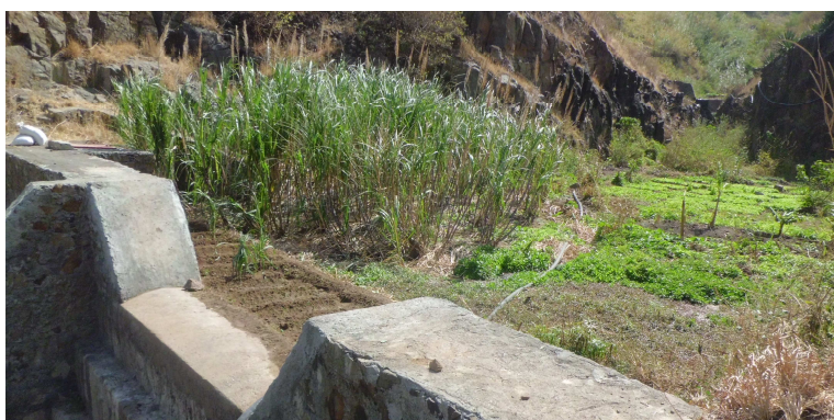
Figura 6 – Dique argamassado de captação de água totalmente assoreado e aproveitado para fazer agricultura irrigada.

A esta ideia sobrepõe-se a do “aumento de áreas de cultivo” (directamente relacionada com a disponibilidade de solo) ( Figura 6 ), entendida por mais de metade dos inquiridos como a principal vantagem que os diques trouxeram ao seu quotidiano.