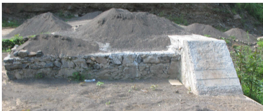
Figura 10 – Dique (de argamassa) de retenção de sedimentos, visto de jusante para montante, em que ocorre a extracção de inertes.

Os diques instalados nos locais onde existem possibilidades de retenção de sedimentos (com potencial para a utilização agrícola) e água utilizável para rega e consumo doméstico, como é o caso dos diques (argamassados) de correcção torrencial e de captação de água, estão sujeitos a uma grande pressão das populações locais pelo uso dos recursos nas áreas envolventes ( Figuras 6 e 10 ), populações que reconhecem as funções que genericamente estão associadas a esses diques de maior dimensão.