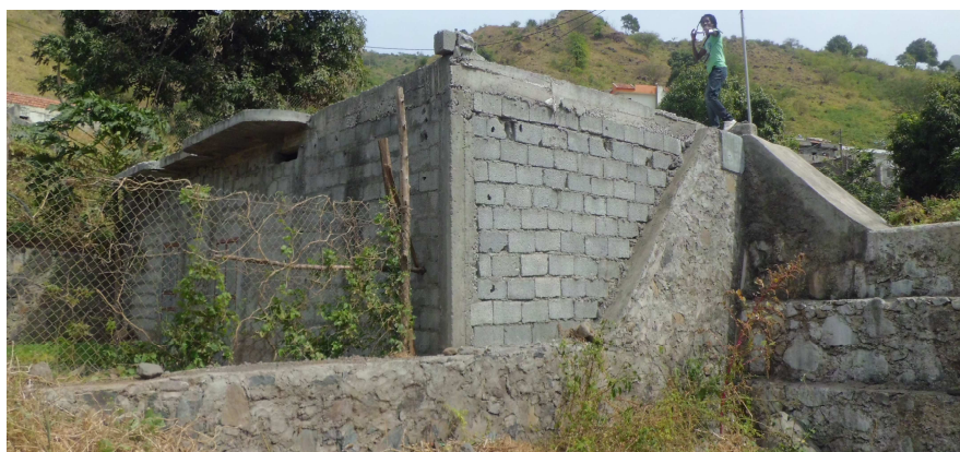
Figura 9 – Dique argamassado de correcção torrencial na sub-bacia de Engenhos, em que uma das asas e o muro de condução foram utilizados para construção de uma casa.

As estruturas dos diques (nomeadamente dos argamassados) podem ser incluídas na estrutura (paredes) de casas de habitação e de currais de animais, bem como servirem para o assentamento de estradas ( Figura 9 ).