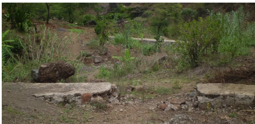
Figura 11 – Dique (de argamassa) de retenção de sedimentos e água com parte da asa removida para permitir a passagem de veículos.

Por exemplo, na bacia, pode observar-se cortes de arames nos diques de gabião ( Figura 7 ) ou, mesmo, arrombamento de parte de diques tanto de pedra seca como argamassado para fazer estradas ( Figura 11 ).