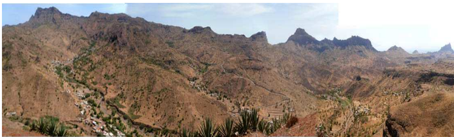
Figura 2 – Sector da bacia de Águas Belas limitado pela cumeeira do Maciço do Pico da Antónia, onde se observa o povoamento ao longo das linhas de água e áreas de regadio e de cultivo de sequeiro ao longo das encostas