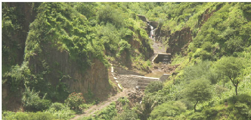
Figura 5 – Diques (argamassados) de correcção torrencial e captação de água (sub-bacia de Mato Gégé) com escadas de acesso para permitir a mobilidade pela ribeira.

Na sub-bacia de Engenhos obteve-se o maior número de homens e de mulheres inquiridas, pelo facto de ser a sub-bacia mais populosa e também com o maior número de diques executados no âmbito do projecto, na maior parte localizados na proximidade das povoações.