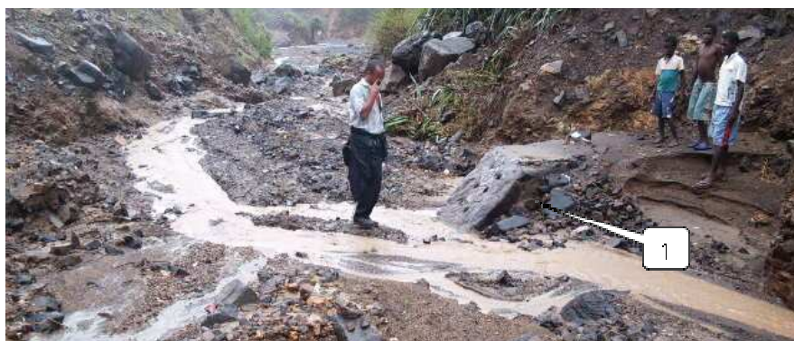
Figura 8 – Dique (argamassado) de retenção de sedimentos assoreado, mostrando o efeito do transporte de grandes quantidades de materiais. 1 - asa do dique.

A utilização das estruturas de correcção torrencial pode implicar um risco não só para as estruturas como também para as comunidades, tanto, mais que estas estruturas se localizam em linhas de água que estão sujeitas a grande caudal de cheia e a enxurradas ( Figura 8 ).