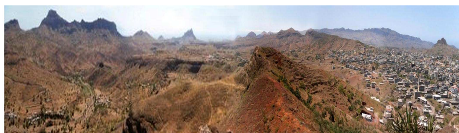
Figura 3 – Sector da Bacia de Águas Belas delimitado pela superfície aplanada de Assomada, onde se observam relevos de materiais de piroclásticos.

A precipitação na Bacia Hidrográfica de Águas Belas varia com a altitude ( Quadro 1 ). No posto udométrico de Charco, que fica na zona árida, a precipitação média anual é de 230 mm, enquanto no posto de Assomada, situado na zona sub-húmida, atinge 478 mm (Diniz & Matos, 1986). A precipitação média anual na área da bacia varia consoante os andares agro-ecológicos, sendo da ordem de 230 mm na zona do litoral e próximo 600 mm na área do Maciço do Pico da Antónia (SCET AGRI, 1981).