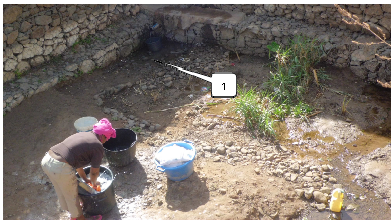
Figura 4 – Dique de correcção torrencial de gabião na sub-bacia de Mato Gégè com função de retenção de sedimentos, onde uma nascente (1) é utilizada para fins diversos.

Nos diques localizados na proximidade de núcleos populacionais, naqueles que são ponto de abastecimento de água ( Figura 4 ) ou usados como estrada ou trilho de acesso pela bacia ( Figura 5 ) também foi possível realizar um número maior de entrevistas por questionário de inquérito.