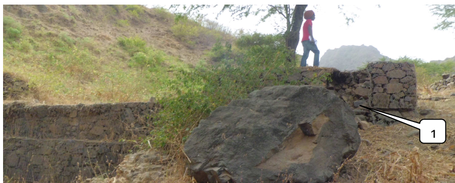
Figura 7 - Dique de gabião, onde foi tirada uma quadra de gabião (1) de uma das asas.

Por exemplo, a extracção de inertes nas áreas envolventes aos diques, a utilização da albufeira dos diques como campo de cultivo ( Figura 6 ), a deposição de lixos nas albufeiras de diques ou mesmo a remoção de arame ou pedra ( Figura 7 ) são acções que colocam em risco não só a estabilidade das estruturas, mas também a segurança das comunidades e parcelas agrícolas aquando a ocorrência de uma chu