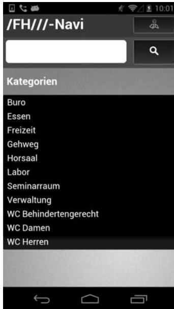
Abbildung 1: Suchfeld