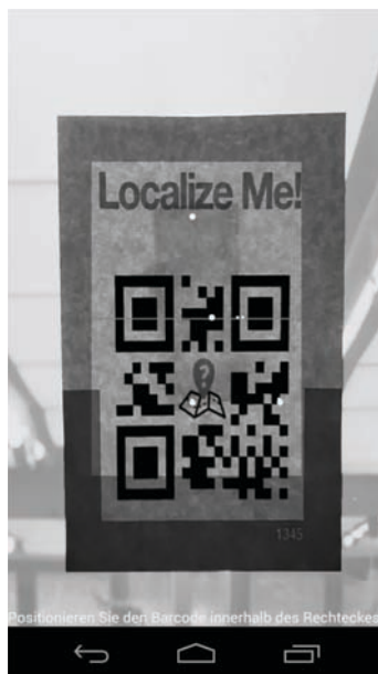
Abbildung 2: QR-Code scannen