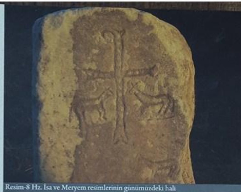
Resim-8 Hz. İsa ve Meryem resimlerinin günümüzdeki hali

Gerek Kozağacı'ndan gelen yol, gerekse Harmancık-Hobandanişment yönünden gelen yol Menteşe'nin üzerinden başlayıp Uzunöz altlarında sona eren Küplüpinar-Karanlık Dere yerleşimine ulaşır. Belenören'in Armutlu mantıkası bitiminde Küplüpinar denilen yerden başlayan kesintisiz yerleşim alanı, Uzunöz altlarında bulunan Karanlık Dere'ye kadar uzanır. Bu eski ören yeri eskiçağda bütün yolların içerisinden geçtiği önemli bir yerleşim alanı idi. Schwertheim da kitabında, aralarında bir hayli mesafe olan Belenören-Kemaliye ve Menteşe'yi bir kompleks olarak