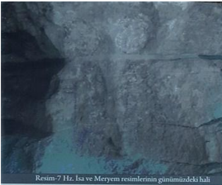
Resim-7 Hz. İsa ve Meryem resimlerinin günümüzdeki hali

yolun güvenliğini sağlamak için yapılan bu kalelerin önemi daha iyi anlaşılabilir. Bunlardan ilki ve en büyüğü karşıda, Fadıl köyünün arazisinde bulunmaktadır. Geniş bir alanı kaplayan kale büyük taşlar ile yapılmıştır. Diğer ise Gelintaşı yerleşiminin hemen üstündedir. Küçük bir alanı kaplayan bu yıkıntıların güney ve batı yönündeki duvarlarının temelleri seçilmektedir. Ancak burasının başka bir amaç ile inşa edildiğini de düşünmek gerekmektedir. Çünkü burası bir kale olamayacak kadar küçüktür. Muhtemelen bir gözetleme kulesi olarak kullanılmıştır.