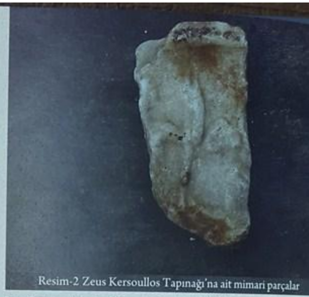
Resim-2 Zeus Kersoullou Tapınağı'na ait mimari parçalar

Olympos Dağı (=Uludağ) antikçağda iyi bir şekilde iskan edildikten başka aynı zamanda tepesinde sık ormanlar ve