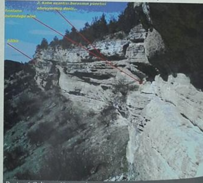
Resim-6 Gelintaşı Kaya yerleşimi

Bölgedeki diğeri önemli antik yerleşim yeri de Menteşe köyüdür. Menteşe Kalesi'ne ilave olarak iki küçük kale yada gözetleme noktasından daha bahsedilir. Bu kaleler muhtemelen Romalılar döneminde Kocasu havalisini gözetlemek için yapılmış olmalıdır. Bu vadinin o dönemde önemli bir ticaret yolu olması göz önüne alındığında, bu