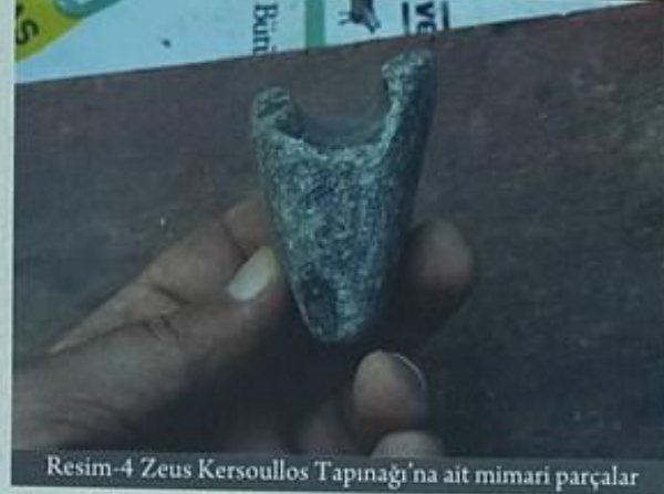
Resim-4 Zeus Kersoullos Tapınağı'na ait mimari parçalar

tapınak kompleksi içinde bir de odeion(11) olduğunu göstermektedir. (Resim 5). Bir çiftçi tanrısı olarak tapınım gören Zeus Kersoullos'un, yerel bir toponimden geldiği ve Rhyndakos (Kocasu) vadisi boyunca Keles, Orhaneli, Büyükorhan, Harmancık, Tavşanlı yörelerinde tapınım gördüğü bilinmektedir. Kersoullos isminin Trak dilinden geçmiş olması, bu inanışın Trak kökenli olduğunu düşündürmektedir. Antik kaynaklarda da bölge halkının Trak kökenli olduğu belirtilmektedir(12).