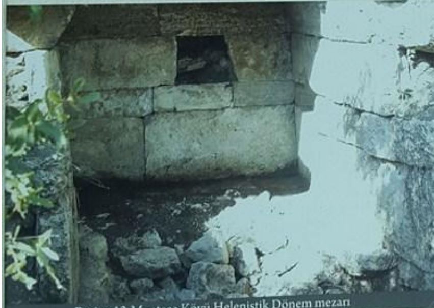
Resim-13 Mentеше Köyü Helenistik Dönem mezarı