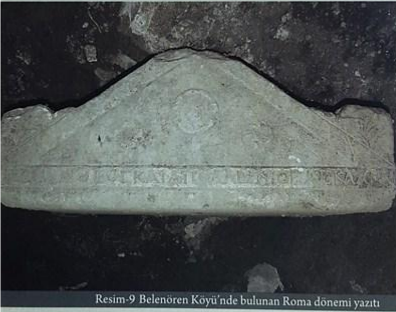
Resim-9 Belenören Köyü'nde bulunan Roma dönemi yazıtı

adını Gelintaşı koymuşlardır. Gelintaşı denilen bu ören yeri Menteşe'nin girişinde bulunan dere yatağı takip edilerek bulunabilir. Bu dere yatağının başlangıç noktası Kilisecik olarak anılır ki eski Menteşe buradadır. Bu dere yatağının Kocasu'ya doğru eğiminin bir uçuruma dönüştüğü noktada, sağda bir kaya başlar. Bu kaya Gelintaşı'dır. Gelintaşı'nın 1. ve 2. katlarının girişi buradadır. Aslında kaya zemini de sayılırsa üç kat olan bu yerleşim alanının zemininde, pek