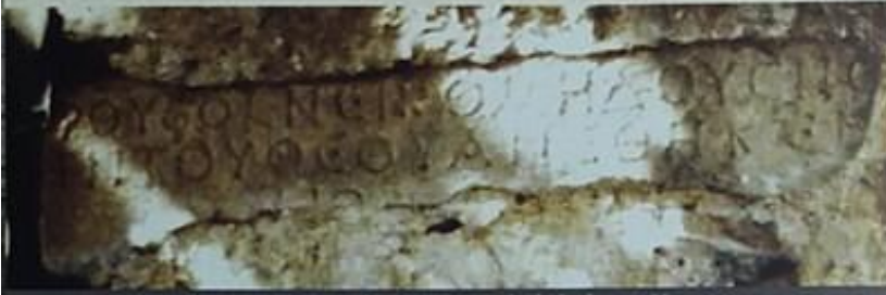
Resim-10 Belenören Köyü'nde bulunan Yunanca yazıt

adını Gelintaşı koymuşlardır. Gelintaşı denilen bu ören yeri Menteşe'nin girişinde bulunan dere yatağı takip edilerek bulunabilir. Bu dere yatağının başlangıç noktası Kilisecik olarak anılır ki eski Menteşe buradadır. Bu dere yatağının Kocasu'ya doğru eğiminin bir uçuruma dönüştüğü noktada, sağda bir kaya başlar. Bu kaya Gelintaşı'dır. Gelintaşı'nın 1. ve 2. katlarının girişi buradadır. Aslında kaya zemini de sayılırsa üç kat olan bu yerleşim alanının zemininde, pek