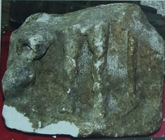
Resim-3 Zeus Kersoullos Tapınağı'na ait mimari parçalar

Yapılan yüzey araştırmaları sonucunda tapınağın yeri Belenören ve Akçapınar köyleri arasında bulunan Tazlak Tepesi olarak lokalize edilmiştir. Muhtemelen tapınak Tazlak Tepesi'nin üzerinde, etrafındaki dini kompleksin ortasında yer almakta idi. Bölgede bulunan çeşitli mimari parçalar bu