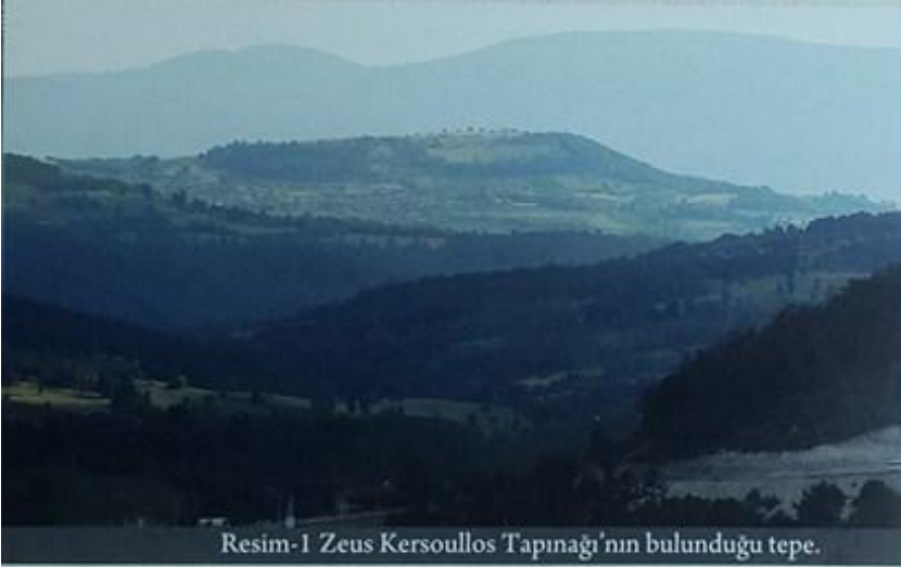
Resim-1 Zeus Kersoullou Tapınağı'nın bulunduğu tepe.

Rhyndakos vadisi antikçağdan itibaren yerleşime uğramış bir bölgedir. Rhyndakos, (=Adranos-Orhaneli Çayı-Kocaçay) Anadolu'nun Mysia ile Bithynia bölgeleri sınırında önemli bir ırmaştır. Rhyndakos ırmağı Bithynia eyaletinin batı sınırını oluşturuyordu(1). Irmağın başlangıç bölümü Aizanoi'dadır (=Çavdarhisar). Byzantionlu Stephanos'a göre, Phrygia ile Hellespontos Phrygia'sı arasında yani Troas