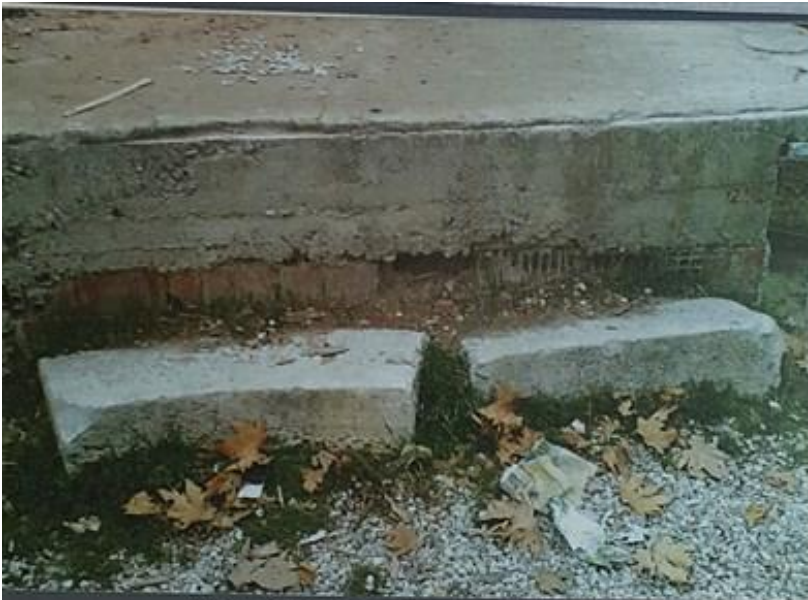
Resim-5 Zeus Kersoullos tapınağı kompleksinde yer aldığı düşünüldüğü müze yapılarına ait mimari parçalar

üzerinde bulunur. Burası yükselerek Akçapınar köyüne doğru ilerleyen ve Tazlak Tepesi ile Çal Tepesi arasında bir geçit teşkil etmektedir. Harabelerin kapladığı alanda bu geçit üzerindedir. Alfani adı verilen bu arazi üzerinde yer alan Alfani Çeşmesi, Taşpınar, İmam Pınarı, Köy Pınarı ve Gürlek (Gürleyik) çeşmeleri bu antik dönemin kanıtlarıdır.