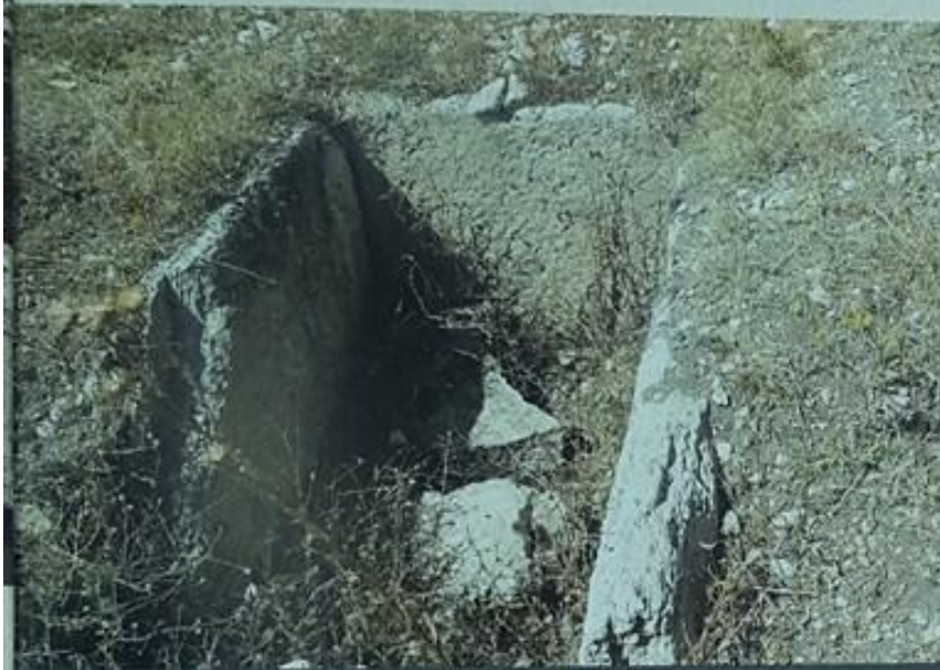
Resim-12 Mentеше Köyü Helenistik Dönem mezarı