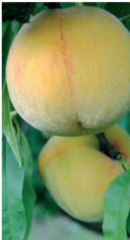
El aspecto exterior de la variedad 58-GC-76 es un melocotón de fondo de piel amarillo pajizo que muestra entre el 20 y el 50% de chapa de color rojo. En el caso del ensayo, esta chapa fue todos los años alrededor del 10%, ya que el fruto crece embolsado.

En los frutales, el conocimiento real de las necesidades en fertilización es muy complejo. Por una parte, al ser un cultivo plurianual, resulta difícil determinar la respuesta del árbol a la fertilización, ya que existe una acumulación de sustancias de reserva en los diferentes ór-