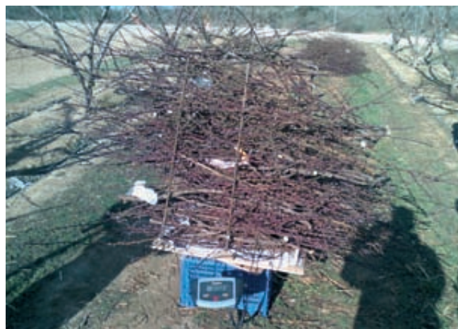
El crecimiento vegetativo medio de los distintos tratamientos también se evaluó a través del peso de la madera de poda invernal.

Por consiguiente, a lo largo de los años de ensayo no se ha encontrado una variación sensible de la presencia exterior del fruto como consecuencia de una variación en la fertiliza-