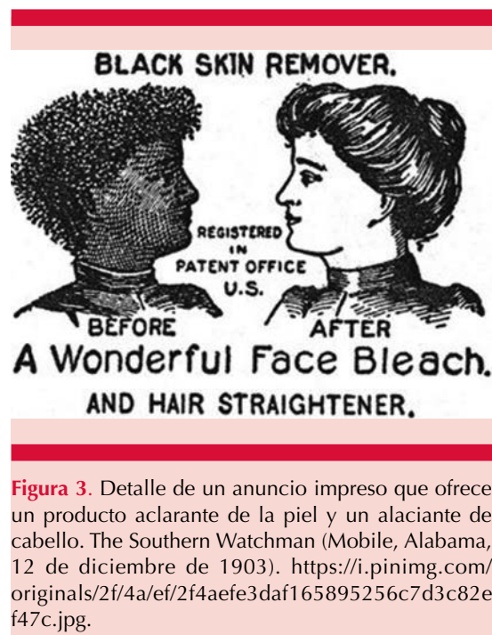
Figura 3. Detalle de un anuncio impreso que ofrece un producto aclarante de la piel y un alaciante de cabello. The Southern Watchman (Mobile, Alabama, 12 de diciembre de 1903). https://i.pinimg.com/originals/2f/4a/ef/2f4aefe3daf165895256c7d3c82ef47c.jpg .