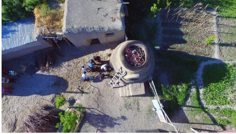
Resim 9. Seramik fırınında pişirilen kapların kor haline gelmesi.