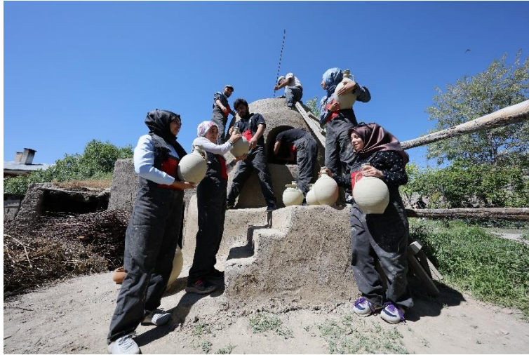
Resim 7. Pişmeye hazır hale gelen kil kapların fırına yerleştirilmesi.