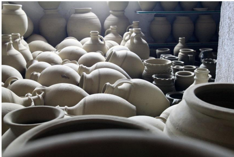
Resim 5. Çarkta çekilen kil kapların gölgede kurumaya bırakılması.