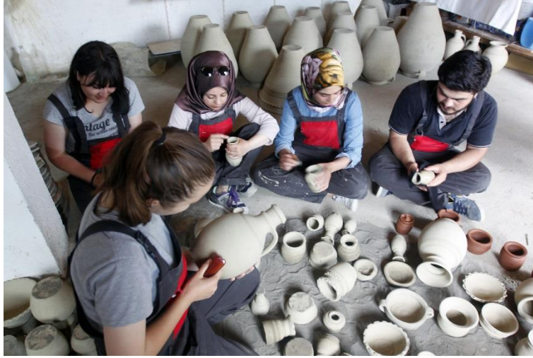
Resim 6. Kuruyan kil kaplara perdah işlemi uygulanması.