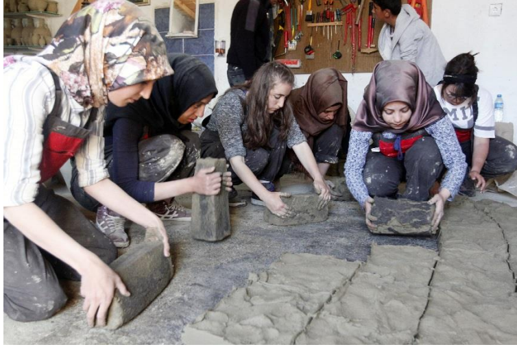
Resim 3. İstenen kıvama gelen kilden palur bloklarının hazırlanması.