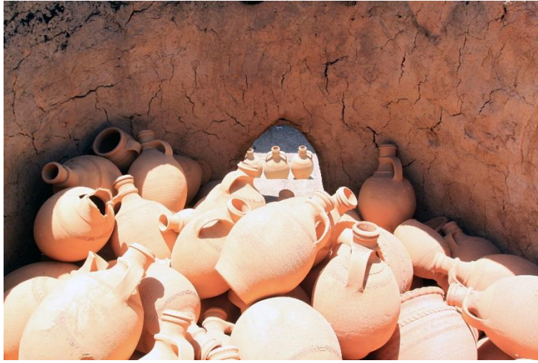
Resim 10. Pişen seramik kapların fırın içindeki görünümü.