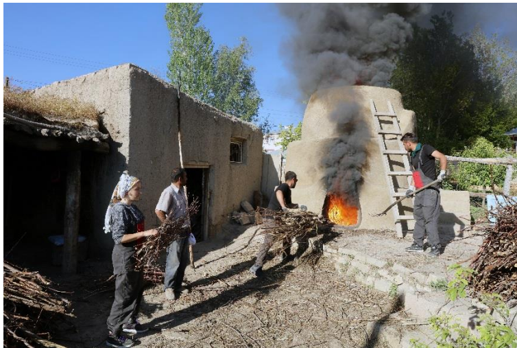
Resim 8. Seramik fırınının yakılması.