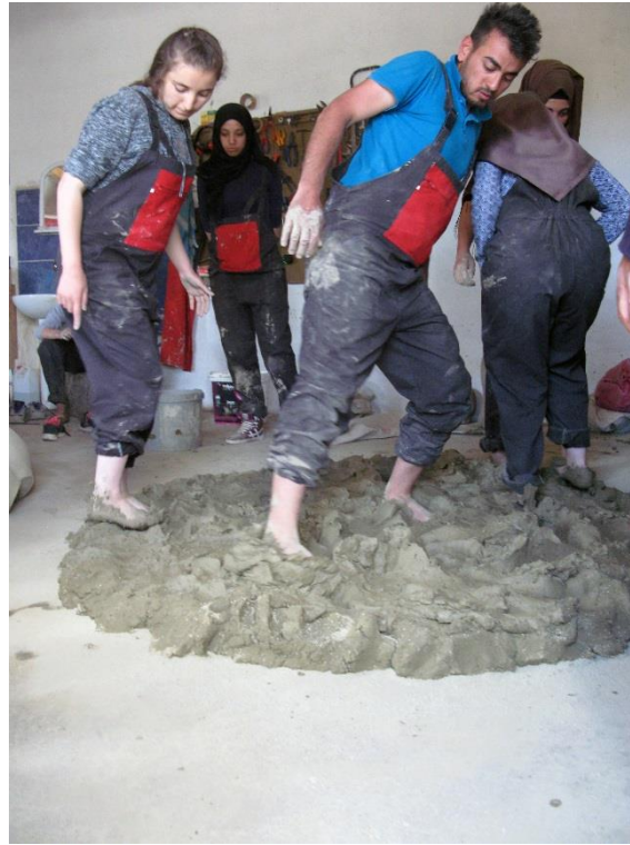
Resim 2. Puşi ve palur karışımının çiğnenmesi.