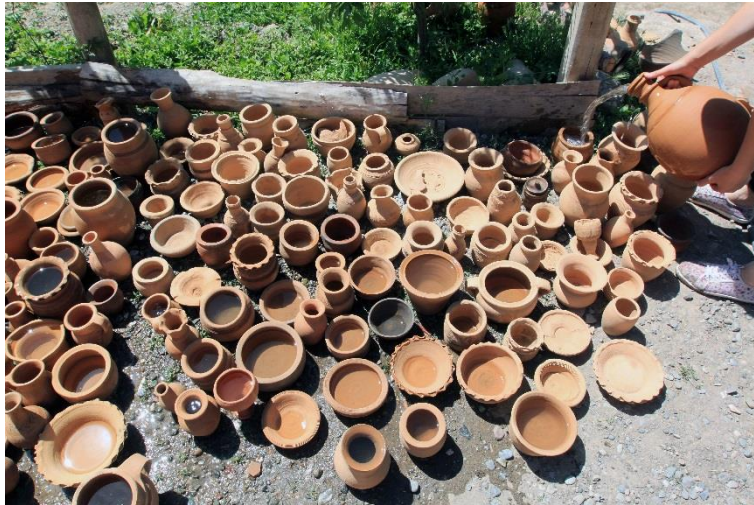
Resim 11. Fırından çıkarılan seramik kapların yıkanarak temizlenmesi.