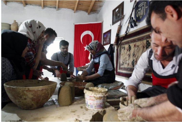
Resim 4. Çark üzerinde kil kapların çekilmesi.