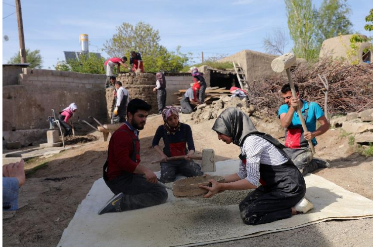
Resim 1. Ham kil güneşte kurutularak tokmakla dövölmüş ve sır elekten geçirilmiştir.