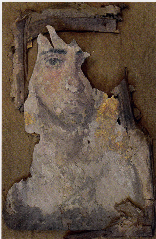
Cat. 28, voir page 16.

Improprement appelés « portraits du Fayoum » , les portraits funéraires peints de l'Égypte romaine sont réalisés soit sur un linceul de lin, soit, comme ici, sur un fin panneau de bois, importé ou bien local (sycamore, figuier). Loin d'être limités à la région du Fayoum, ils ont été en usage sur l'ensemble du territoire égyptien, du I er siècle jusqu'au milieu du III e siècle apr. J.-C., voire, de manière exceptionnelle à Antinoé, jusqu'à la fin du IV e siècle apr. J.-C. L'état fragmentaire de l'objet ne permet pas d'assurer une datation précise.