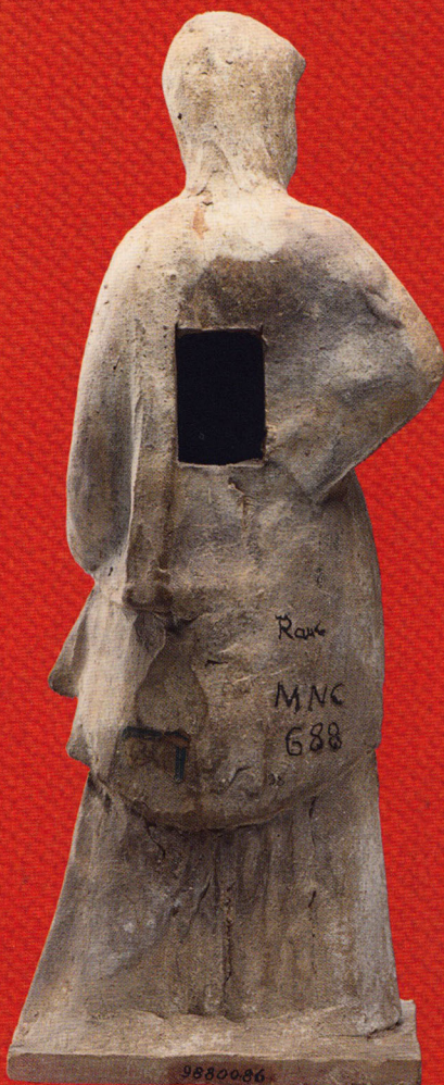
Figurine féminine de type tanagraïen (cat. 20). Musée du Louvre [MNC 688]. Argile, figurine moulée. MNC 688