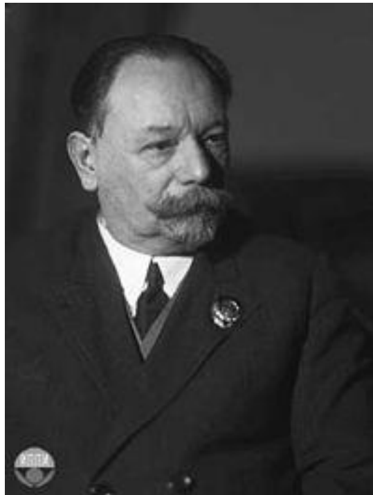
Рис. 4. Терпигорєв Олександр Митрофанович

Належне місце в технічному прогресі посіла наука, в тому числі фундаментальна. Відомі вчені запрошувалися на засідання з'їздів гірничопромисловців, на яких вони виступали з науковими доповідями, повідомленнями та практичними рекомендаціями.