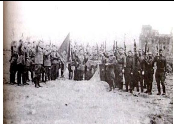
Рис. 5. Похороны артиллеристов дивизиона, погибших при штурме Рейхстага

В боевых донесениях было написано: «В боях за предместье и центр Берлина противотанковый дивизион... все время находился на