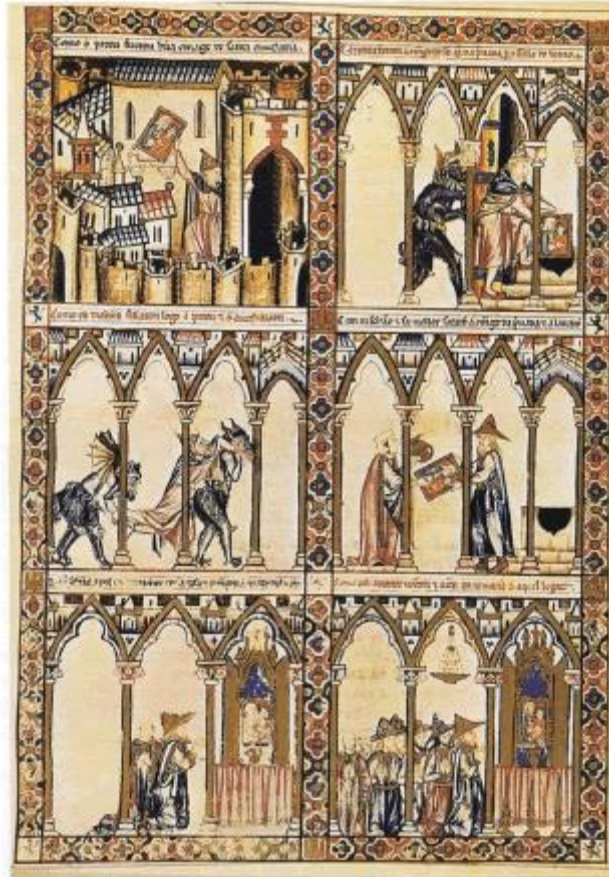
Figure 1: Figure of King Alfonso X, suggesting the existence of a direct connection between Meshal Haqadmoni and Alfonso's book.