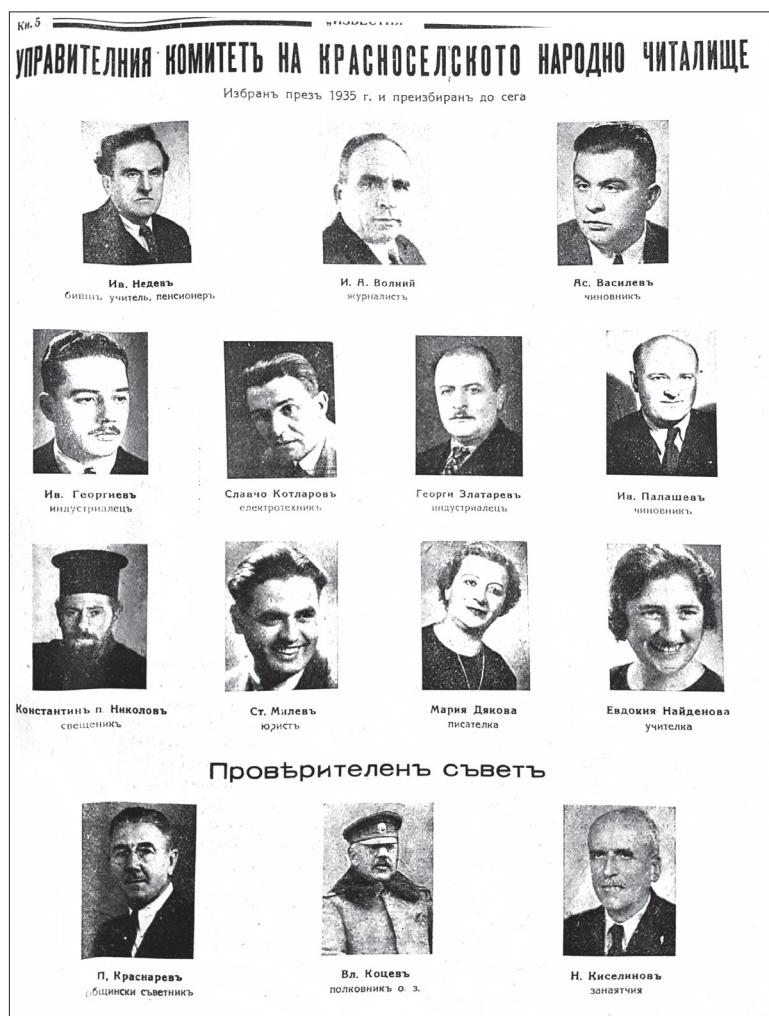
Обр. 5. Управителен комитет на Красноселското читалище