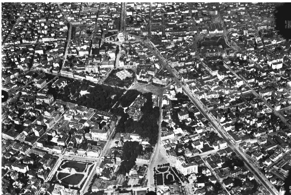
Обр. 1. Въздушна снимка на софийския център откъм пл. „Св. Ал. Невски“, 16.08.1929 г.