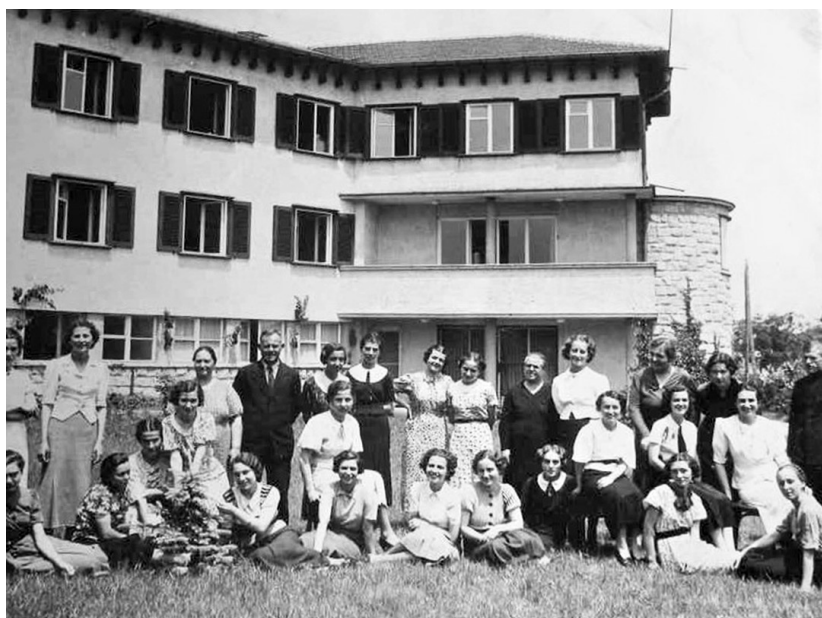
Обр. 4. Пенсионерки и настоятели пред сградата на Дом „Анка Гешова“, с видимост на параклиса, 1936 г. (Личен архив)