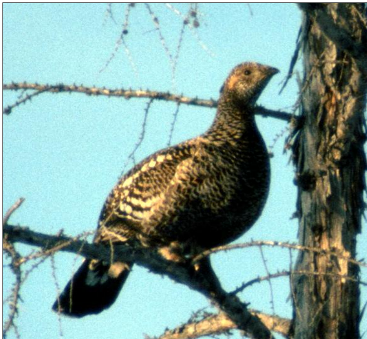
6. Tétrás à bec noir Tetrao parvoristris , femelle, nord-est de la Sibérie, mai 2004 (Siegfried Klaus). Female Black-billed Capercaillie, north-eastern Siberia.

des études approfondies sur l'écologie des tétras dans les Balkans sont maintenant nécessaires pour confirmer ces hypothèses.