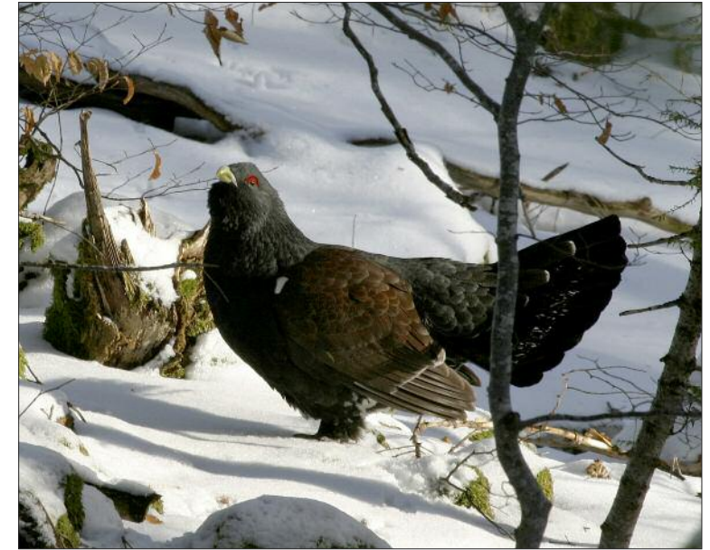
7. Grand Tétrás Tetrao urogallus major , mâle, Jura, janvier 2004 (Didier Pépin). Male Capercaillie of the central European race major.