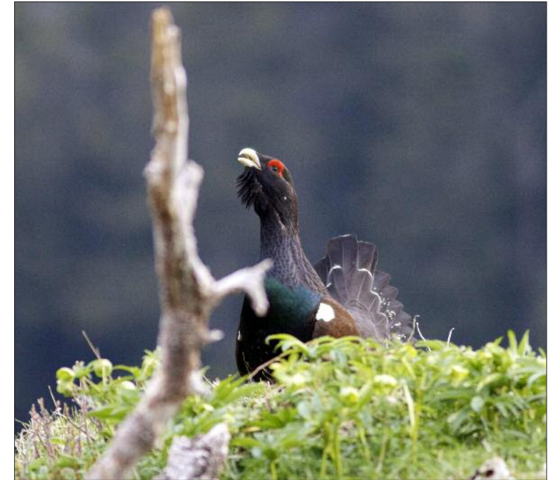
2. Grand Tétrás Tetrao urogallus aquitanicus , mâle, Pyrénées, mai 2008. Male Capercaillie of the Pyrenean race aquitanicus .

sol acides), chênaies à chêne sessile –, à partir du moment où ces forêts présentent un couvert assez clair pour qu'une végétation de sous-bois s'y développe (Ménoni 1991). Les formations pionnières proches de la lisière supérieure des forêts, ainsi que les landes subalpines à rhododendrons ferrugineux, myrtilles et genévriers, sont également de très bons habitats dans la chaîne des Pyrénées et rappellent fortement les habitats occupés par le Tétrás lyre Tetrao tetrix dans les Alpes. Ce dernier étant absent des Pyrénées depuis la dernière glaciation, tout se passe comme si le Grand Tétrás pyrénéen avait élargi sa niche écologique à celle laissée vacante par le Tétrás lyre (Ménoni et al. 2005a), un phénomène classique dans les situations insulaires (Newton 2003).