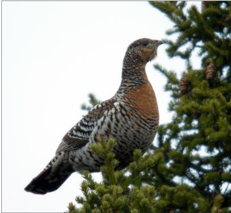
5. Grand Tétrás Tetrao urogallus major , femelle, Finlande, mai 2008 (Marc Duquet). Female Capercaillie of the Scandinavian race urogallus .