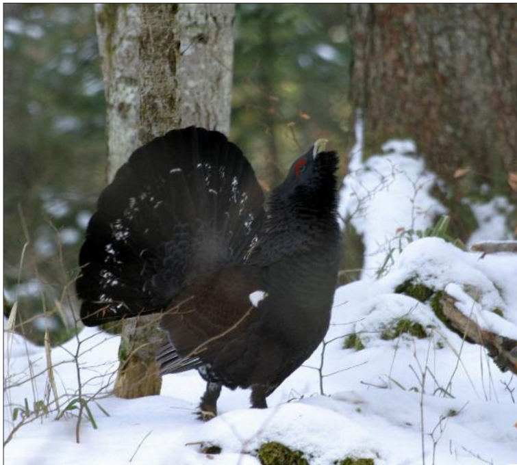
1. Grand Tétrás Tetrao urogallus major , mâle, Jura, janvier 2004 (Didier Pépin). Male Capercaillie of the central European race major .

Dans les Pyrénées françaises, la tranche d'altitude potentiellement favorable à l'espèce se situe de 900 à 2400 m. Les habitats utilisés sont très variés – sapinières et hêtraies pures, hêtraies-sapinières, pinèdes (de pins à crochets sur sol acide mais aussi calcaire, de pins sylvestres sur ravin d'ours ou sur