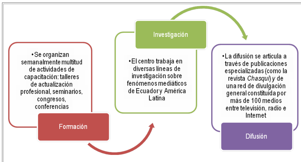
Figura 1: Pilares básicos de la actividad de CIESPAL en 2014

fundación, en 1960, se publicó la primera investigación en la institución ecuatoriana: "La prensa escrita en América Latina" (Ayala, 2009 p. 44). CIESPAL, en esos años, actuó como un catalizador de la naciente investigación en comunicación en América Latina (Beltrán, 2007), un impulsor de las redes que emergían con fuerza desde todos los puntos de la región latinoamericana. Pero junto a una apuesta decidida por la investigación, desde bien pronto comenzó a fraguarse en la institución ecuatoriana una apuesta por la capacitación de los profesionales de la información (Mellado, 2010). Esta apuesta estaba relacionada con un deseo de ciertas organizaciones internacionales, como la ONU, por impulsar la actualización de los conocimientos de los periodistas de los países en vías de desarrollo (Esteinou, 2002), no exenta, obviamente, de un interés político.