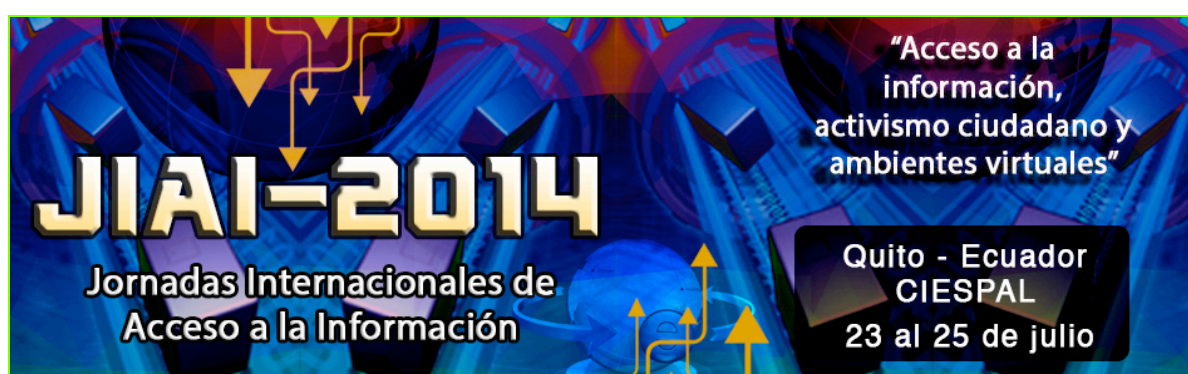
Figura 3: Imagen oficial de las JIAI-2014 en CIESPAL

Las JIAI se insertan en un ambiente dinámico, con amplitud internacional, fruto del trabajo continuado de una red de expertos e investigadores constituida en el año 2010, en Santiago de Chile durante el Congreso de la Internacional del Conocimiento. En enero del 2013, precisamente, se celebró en el mismo país la segunda edición. Meses más tarde, en octubre del mismo año, se culminó con éxito la tercera edición en la sede de la Universidad de Antioquia (Medellín, Colombia), con la denominación JIAI-2013. En esa ocasión, en función de la participación de tres expertos Prometeos de la Senescyt, se iniciaron las primeras tentativas para la realización de un evento en Ecuador.