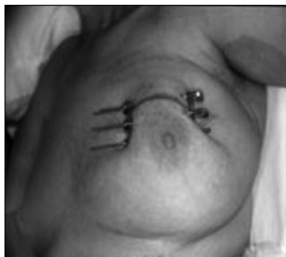
Figura 2. Braquiterapia de alta tasa