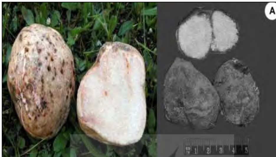
شکل ۱: TERFEZIA ARENARIA (Moris) TRAPPE

(منبع (TRANS. BR. MYCOL. Soc. 57(1): 90: 1971) ۱ )