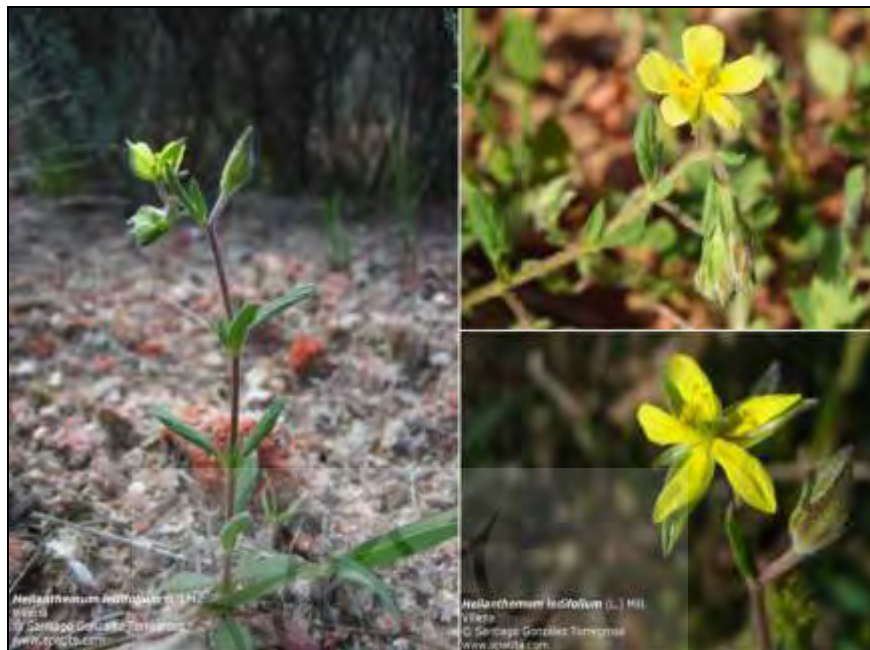
شکل ۴- تصویر گونه Helianthemum ledifolium