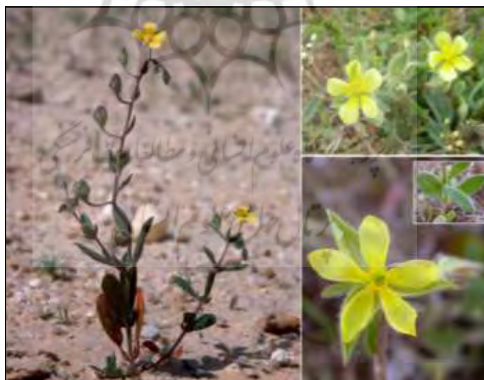
شکل ۵- تصویر گونه HELIANTHEMUM SALICIFOLIUM