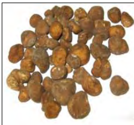
شکل ۲- Picoa lefebvrei ، اندازه متوسط طـ ۱۷/۹ میلیمتر؛ بیشترین طول - ۳۱/۴، کمترین طـ ۱۰/۳، اندازه‌گیری با استفاده از نرم‌افزار Image J