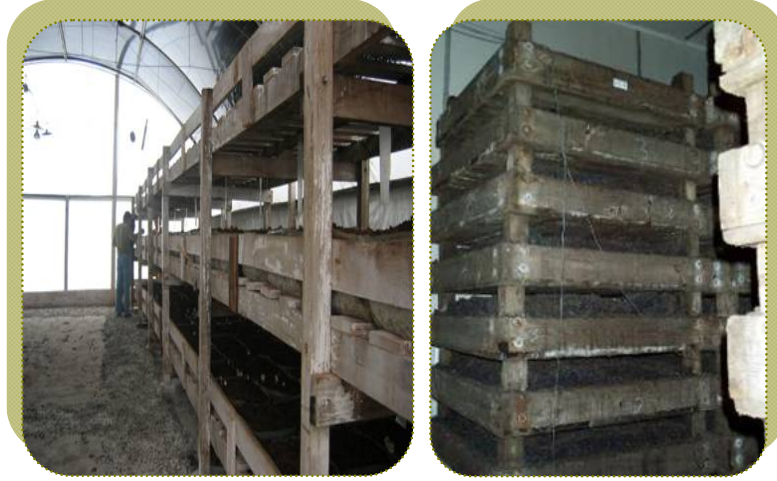
شكل الأرفف الخشبية التي تستخدم في زراعة فطر عش الغراب

ويستخدم في هذه الحالة عدد من الرفوف فوق بعضها من 5-6 صفوف، وترص البيئة على سطح الرف (15سم) ثم توضع التقاوي فوقها. و تغطى بطبقة من البيئة (5سم) بعد ذلك، ثم تغطيتها بالبلاستيك فوق الرف بطول وعرض الرف. وتعتبر هذه الطريقة من أفضل الطرق في المزارع المجهزة خصيصاً لذلك.