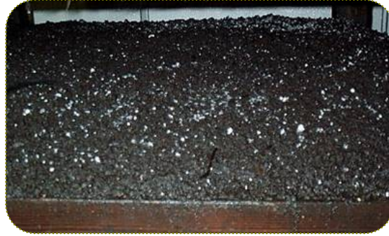
خلط الاسبون مع الكومبوست بداخل الأرفف الخشبية

ويتم في الاسبون في الكومبوست ويمكن إجراؤها آلياً أو يدوياً، وذلك إما في الكومبوست على الرفوف السابقة أو في الأكياس كبيرة الحجم المحملة على الرفوف. ويجب أن تكون درجة الحرارة أثناء الزراعة وداخل العنبر من (25-27°م)، حيث يبدأ الميسليوم في الظهور بعد أسبوعين من الزراعة وبعدها يلزم عمل التغطية.