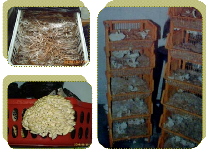
فطر عش الغراب في الصناديق البلاستيكية على اختلاف أنواعها

في هذه الطريقة ترص الصناديق البلاستيكية فوق بعضها (حوامل الخضار) وتوضع البيئة على سطح الصندوق (10سم)، ثم ترش التقاوي فوقها ثم غطى بطبقة اقل من البيئة (5سم)، بعد ذلك يتم تغطية الصناديق كلها بكيس بلاستيك كبير خلال فترة التحضين والتي تصل من أسبوعين إلى ثلاثة أسابيع. بعد ذلك يتم رفع الأكياس البلاستيك بعد ظهور الميسليوم، وترش الصناديق يوماً برذاذ بسيط من الماء حتى الإثمار (بعد أسبوعين من رفع الغطاء). وفضل طريقة الزراعة باستخدام الصناديق البلاستيك في الشقق والمطابخ لأنها لا تأخذ حيز من المكان وسهل نقلها من مكان لآخر ويمكن التوسع الرأسي باستخدامها.