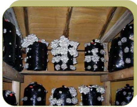
شكل النمو لفطر عيش الغراب والإثمار في الأكياس البلاستيك