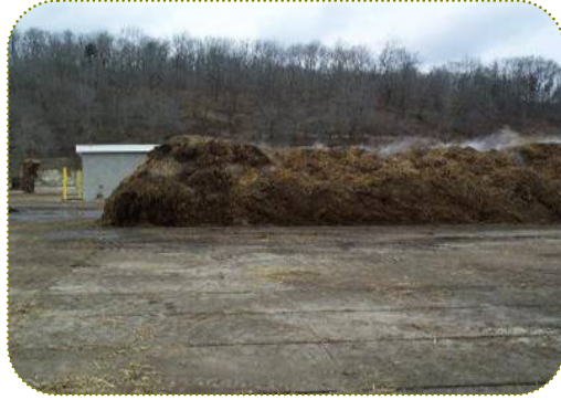
صورة توضح عملية التخمير للمخلفات النباتية لعمل الكومبوست

يمكن عمل الكومبوست (البيئة المتخمرة) من جميع المخلفات النباتية، مثل قش الأرز، تبن القمح، الشعير أو حطب القطن، ويضاف إليها سبله الخيل أو زرق الدواجن، واليوريا، والجبس الزراعي، ثم تخلط جميعها ويرش الماء وتشكل على هيئة كومة. وتقلب الكومة كل 3 أيام لمدة 4مرات، وفي أثناء هذه المرحلة يحدث أن ترتفع درجة الحرارة داخل الكومة إلى حوالي 70م ويجب أن تكون الكومة بأبعاد 1.5م ارتفاع، 1.5 م عرض، 2 م طول على الأقل. ويتغير لون القش إلى اللون الغامق ونسبة النتروجين 1.5% وهناك عدة طرق ونسب مختلفة قد تصل إلى أكثر من 100 خلطة مختلفة لعمل الكومبوست .