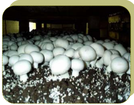
فطر عيش الغراب من النوع البوتون ( Agaricus bisporus ) Button

2- الاويستر Oyster أو البلوروتس Pleurotus spp. : وهو ينمو في ظروف المناطق تحت الاستوائية الإفريقية والآسيوية، ومنه أنواع تزرع في