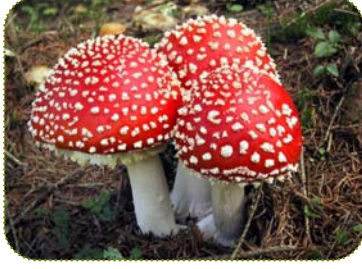
عش الغراب الذبابة

وهو من أجمل أشكال عيش الغراب لذا لا يخطئه الإنسان ولذلك لا يسبب الموت، بل استخدمه الإنسان في عمل أشكال وألعاب جميلة والأدوات المنزلية والمكتبية وصور الأغلفة وأفلام الكارتون، إلا أن تناوله يؤدي إلى التسمم واختلال عصبي، على الرغم من أنه يستخدم في صناعة المبيدات الحشرية إلا أن بعض القبائل البدائية كانت تستخدمه كمادة مخدرة.