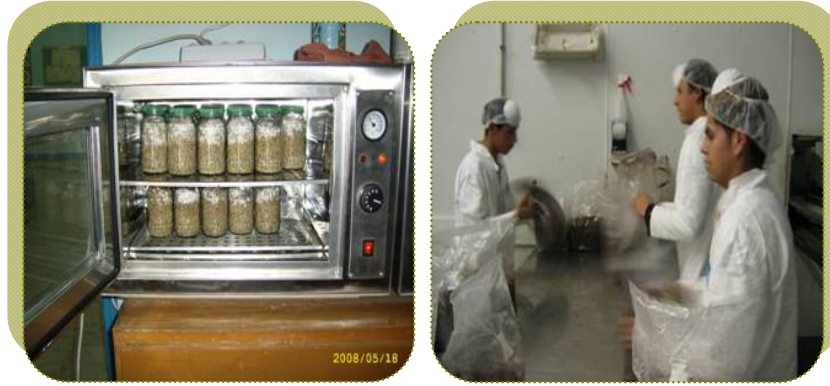
صور توضح عملية إكثار التقاوي وعملية التخمير في أجهزة التحضين

100 جم قمح أو الشعير + 140 مل ماء معقم + 2 جم طباشير أو كربونات كالسيوم، ثم تقفل بسداده قطنية وتوضع داخل الأوتوكلاف للتعقيم على درجة 121م لمدة 45/ق، بعد ذلك تلتح بيئة الحبوب المعقمة بعد تبريدها بميسيليوم الفطر المنمى حديثا علي بيئة الآجار، ثم يتم تحضين الزجاجات علي درجة 28م لمدة أسبوعين.