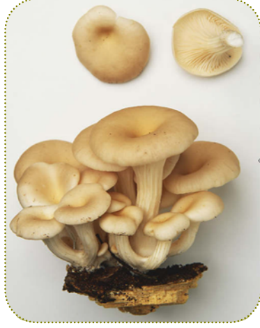
فطر عش الغراب من نوع Oyster ( البلوروتس ) Pleurotus spp.

الدول الأوروبية وعلى درجات الحرارة المنخفضة. وهو يوجد في جو مصر طوال العام ويمكن العمل على انتشاره داخل كل بيت لكي يكون مصدر دخل لربة الأسرة، الشباب، الأسر المنتجة والمزارع الصغيرة، وقد نجحت زراعته في مصر وتقدمت تقدماً كبيراً شمل جميع محافظات مصر.