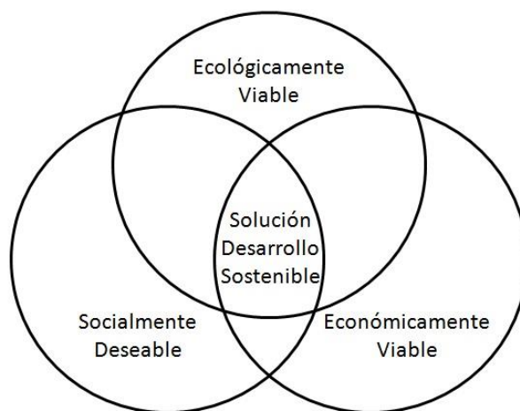
Figura 3. Intersección de los elementos clave que engloba el Desarrollo Sostenible .