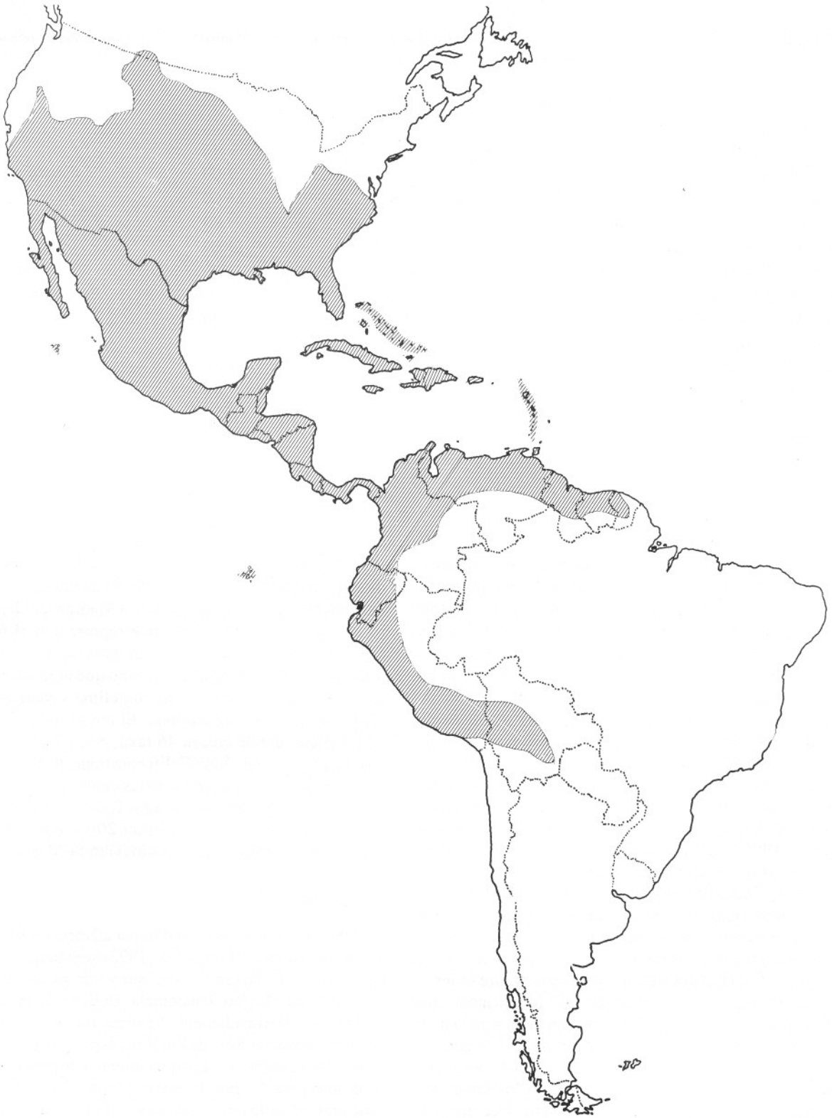
FIGURA 1. Distribución de la familia Agavaceae.