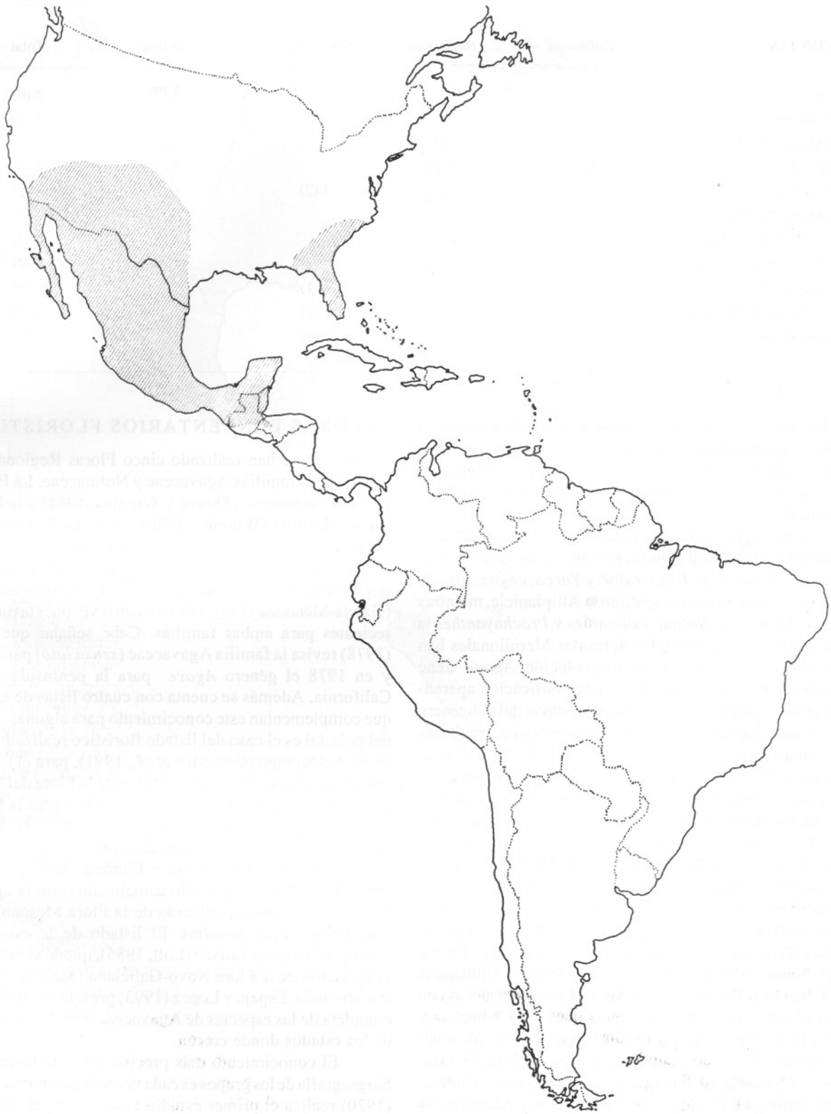
FIGURA 2. Distribución de la familia Nolinaceae (modificado de Hernández, 1993).