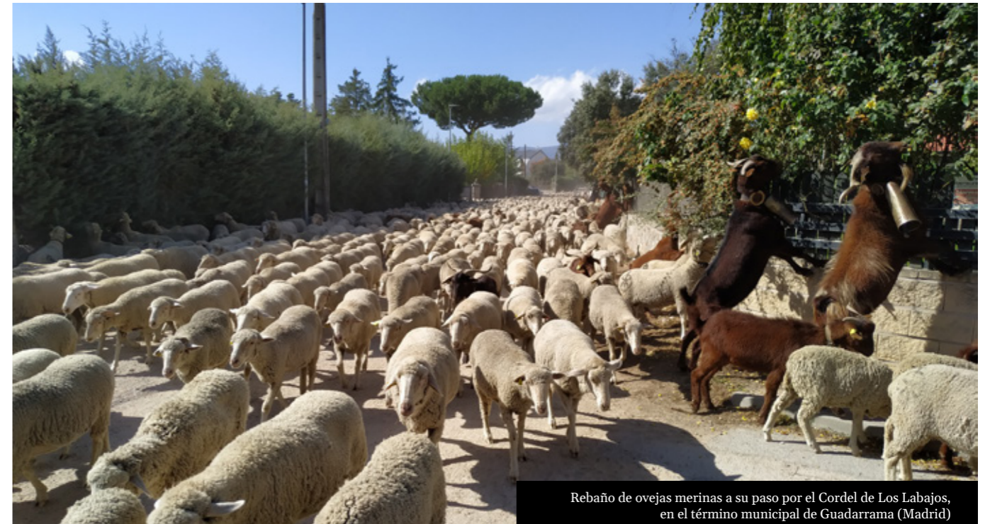
Rebaño de ovejas merinas a su paso por el Cordel de Los Labajos, en el término municipal de Guadarrama (Madrid)

la medida de valores intangibles, aunque especialmente importantes para el bienestar humano. Revisiones bibliográficas sobre el tema demuestran que este tipo de servicios son los menos cuantificados y cartografiados 10,11,12 . De hecho, la valoración y mapeo de servicios como el turismo rural y de naturaleza representan un desafío debido, entre otras razones, a su valor no material y a su dependencia de constructos sociales 13 .