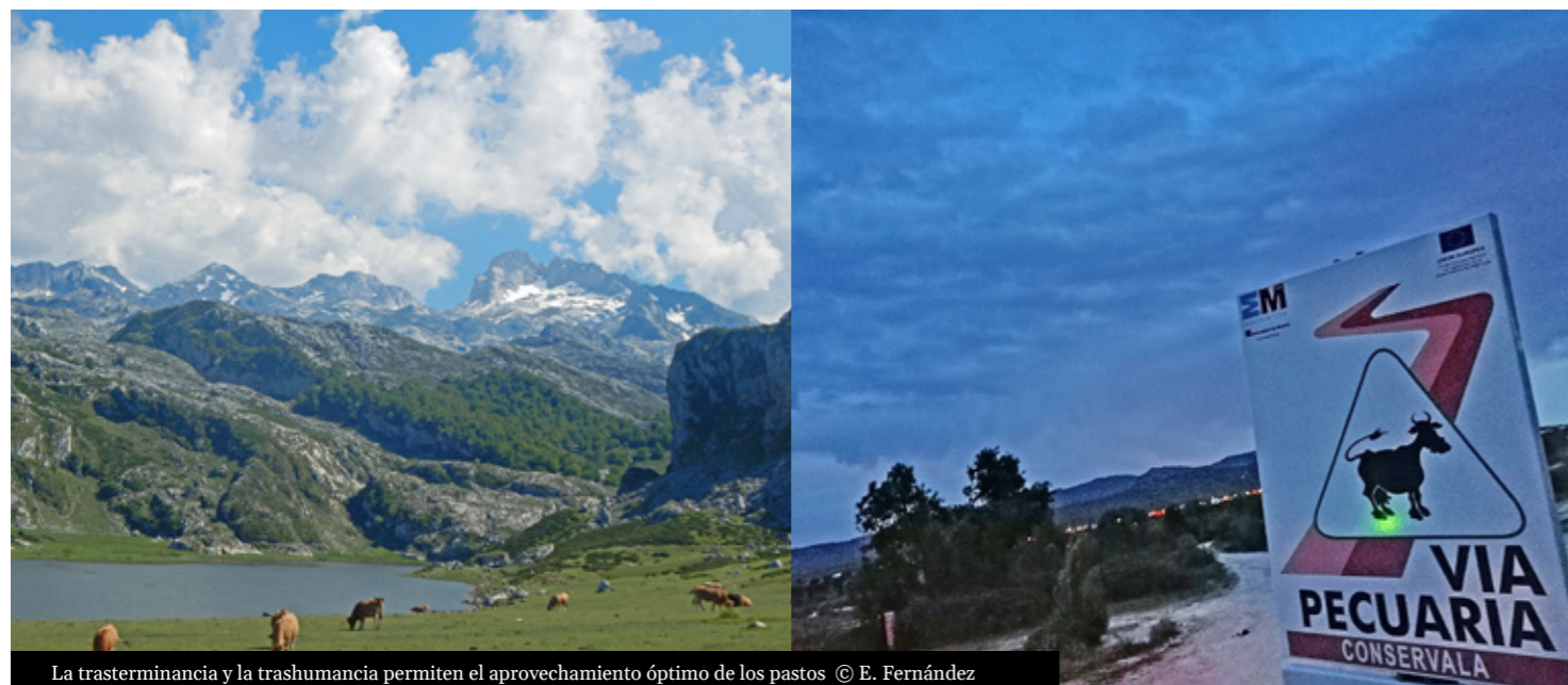
La trasterminancia y la trashumancia permiten el aprovechamiento óptimo de los pastos

A pesar de ello, no es frecuente reconocer la importancia de los servicios culturales en los esquemas de planificación territorial y en el desarrollo de políticas ambientales. Esto parece deberse a problemas y dificultades relacionados con la subjetividad inherente a