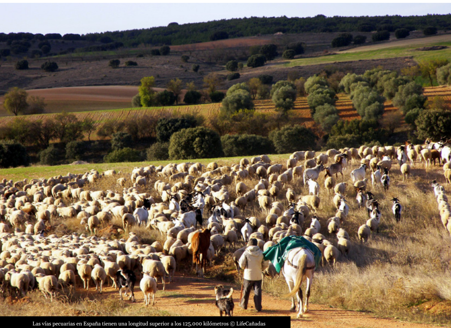
Las vías pecuarias en España tienen una longitud superior a los 125.000 kilómetros

Departamento de Biodiversidad, Ecología y Evolución. Universidad Complutense de Madrid