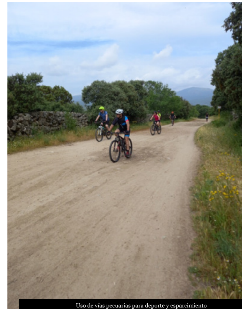
Uso de vías pecuarias para deporte y esparcimiento

Un estudio reciente realizado en la Comunidad de Madrid recopila información de bases de datos públicas, cartografía disponible y encuestas a visitantes de paisajes rurales 14 . El estudio desarrolla un método eficiente que, considerando la aceptación o rechazo de los visitantes por los elementos del paisaje, facilita la cuantificación y expresión cartográfica de la demanda recreativa. Este procedimiento expresa numéricamente la correspondencia o acoplamiento entre la demanda recreativa de los visitantes, en función de sus preferencias, y la